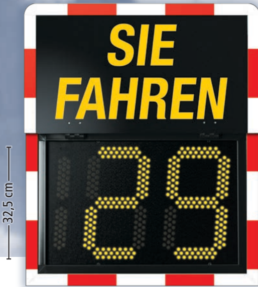
Abmessung: 63,4 x 78,6 x 18,2 cm (B x H x T), mit geklappter Frontblende 63,4 x 48,2 x 18,2 cm