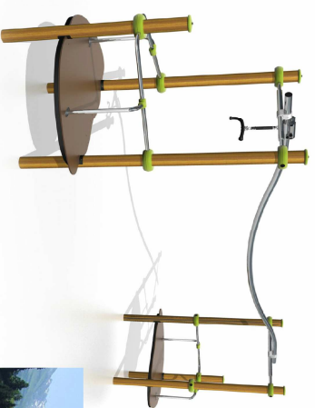
Schienenbahn "Aerospeed", Fa. Proludic