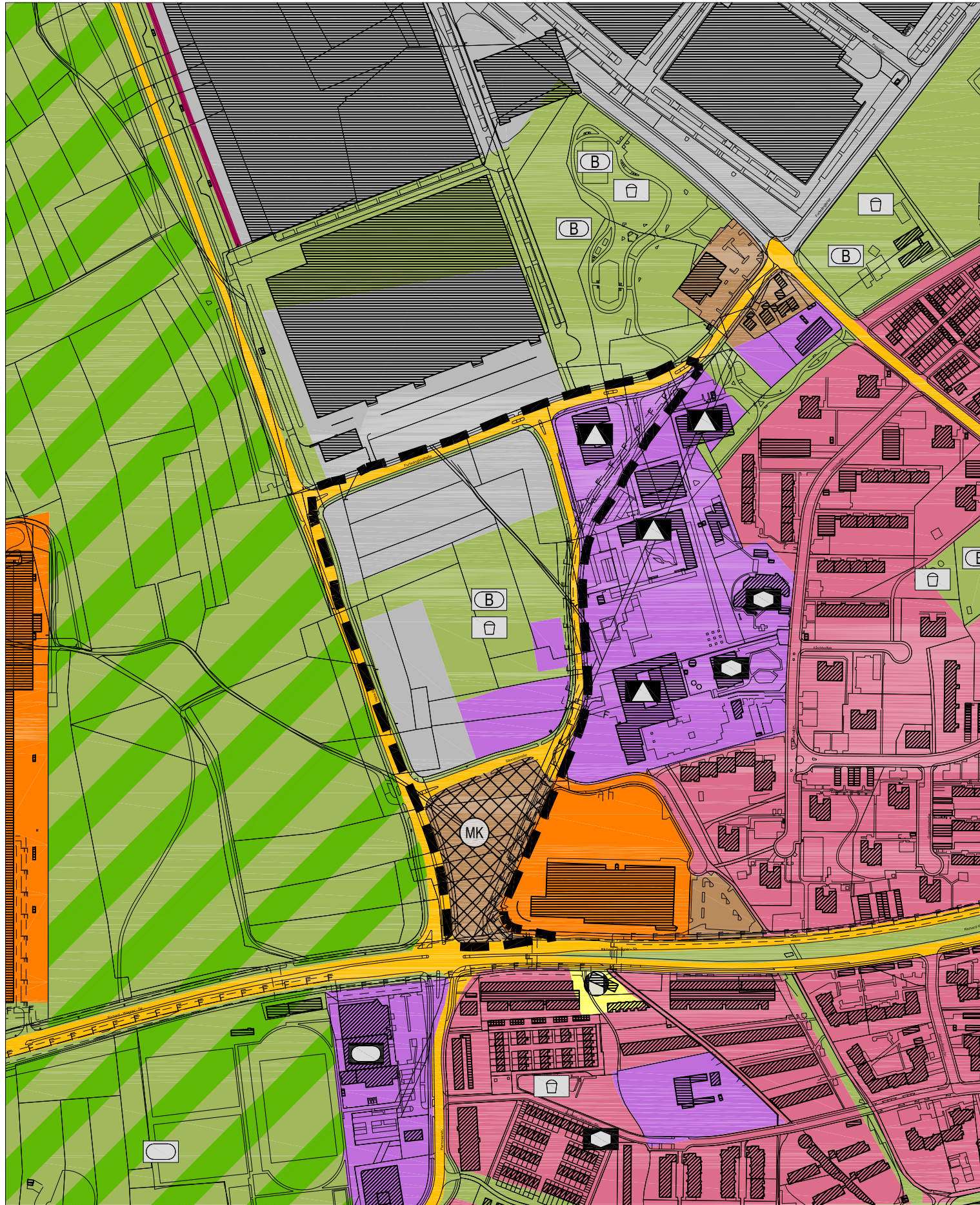
Änderung M 1:5000