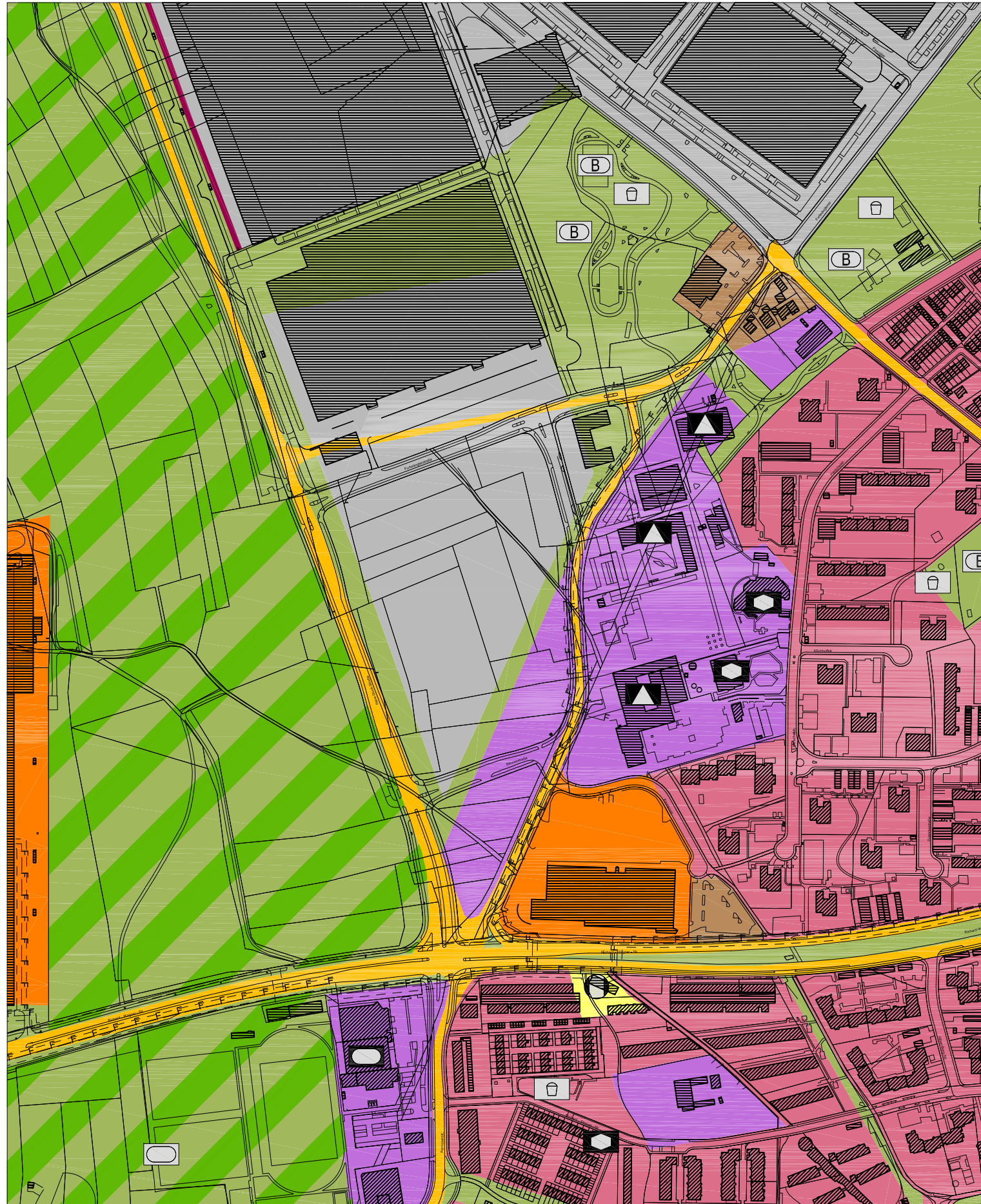
Rechtswirksamer Stand M 1:5000