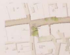
„im Bereich von Bäumen, die -ergänzt durch einzelne Neupflanzungen - schon im Bestand den Verlauf von Theresien- und Ludwigstraße unregelmäßig begleiten“