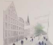
„Möbiliar in Modubauweise: Wortstehende Flexibilität, situationsbedingte Konfiguration.“