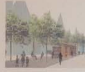
„Verweil- und Aktionsband“