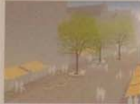
„die Ausstattung des öffentlichen Raumes aus einer Gestaltfamilie“