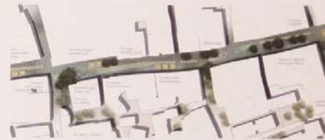
„in der 3. Dimension kommen zu den Bestandsgehölzen wenige neu gesetzte Gehölze hinzu“