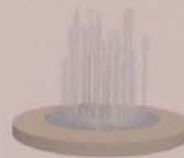
Brunnen am Brühlmarkt