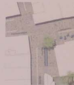
„Mit einem großen Brunnenelement, das zum Sitzen am Wasser einlädt, als attraktivem Anziehungspunkt“