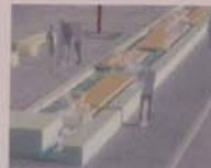
„Beispiel für einen Brunnen mit Sitzelementen“

„Wasserspiele säumen gleich einer Perlenkette den Verlauf von Theresienstraße und Ludwigstraße.“