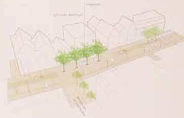
„Der große Lesesaal: in Bezug zur südlich liegenden Stadtbücherei entsteht unter vier Gehölzen ein Raum zum Ruhen und Lesen“