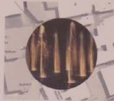
„Keines interaktives, lichtinszeniertes Wasserspiel“

aus der Ausschreibung der 1. Wettbewerbsstufe