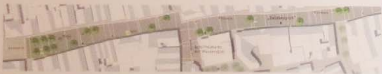
„Locker gesetzte Neupflanzungen“

aus der Auslobung der 1. Wettbewerbsstufe