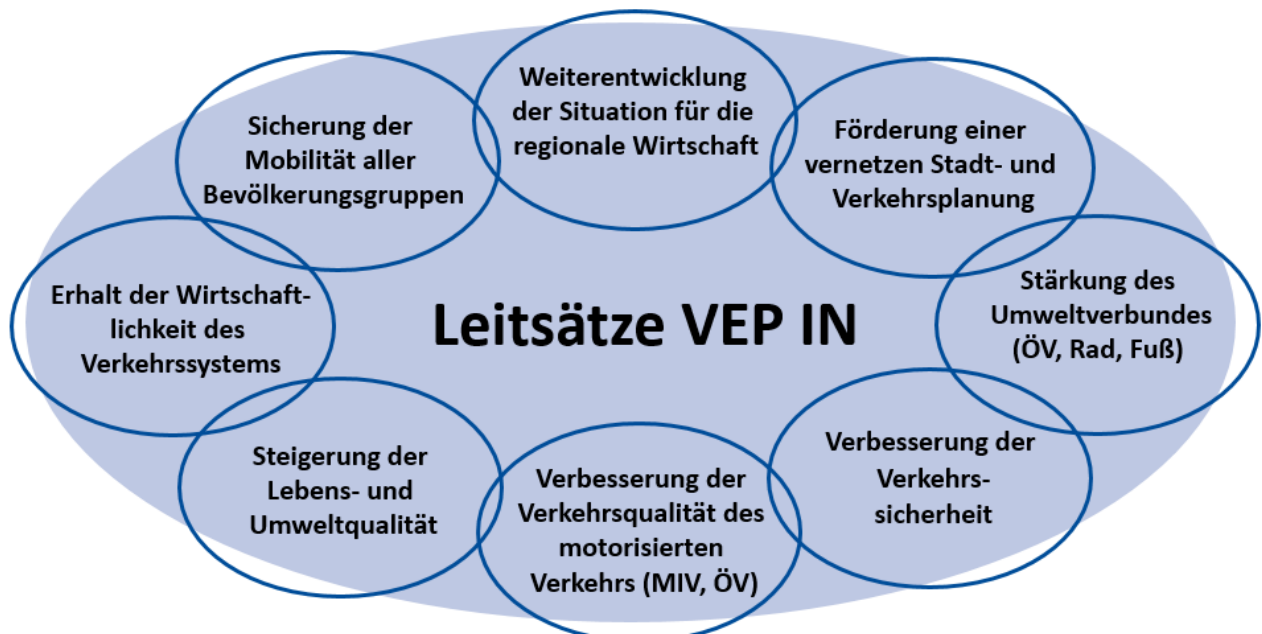
Entwurf der Leitsätze zum Verkehrsentwicklungsplan Ingolstadt

Aus den Ergebnissen der Zustandsanalyse wurden verschiedene Leitsätze und dazugehörigen Handlungsziele abgeleitet. Diese stellen das übergeordnete Leitbild für das verkehrspolitische Handeln der Stadt Ingolstadt in der Zukunft dar. Die Leitsätze stehen ohne Priorisierung gleichberechtigt nebeneinander.