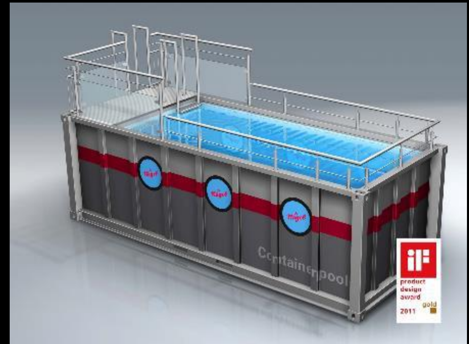
Ein Beachbereich mit Blick aus dem Pool auf die Rennstrecke ( incl. Bademeister)