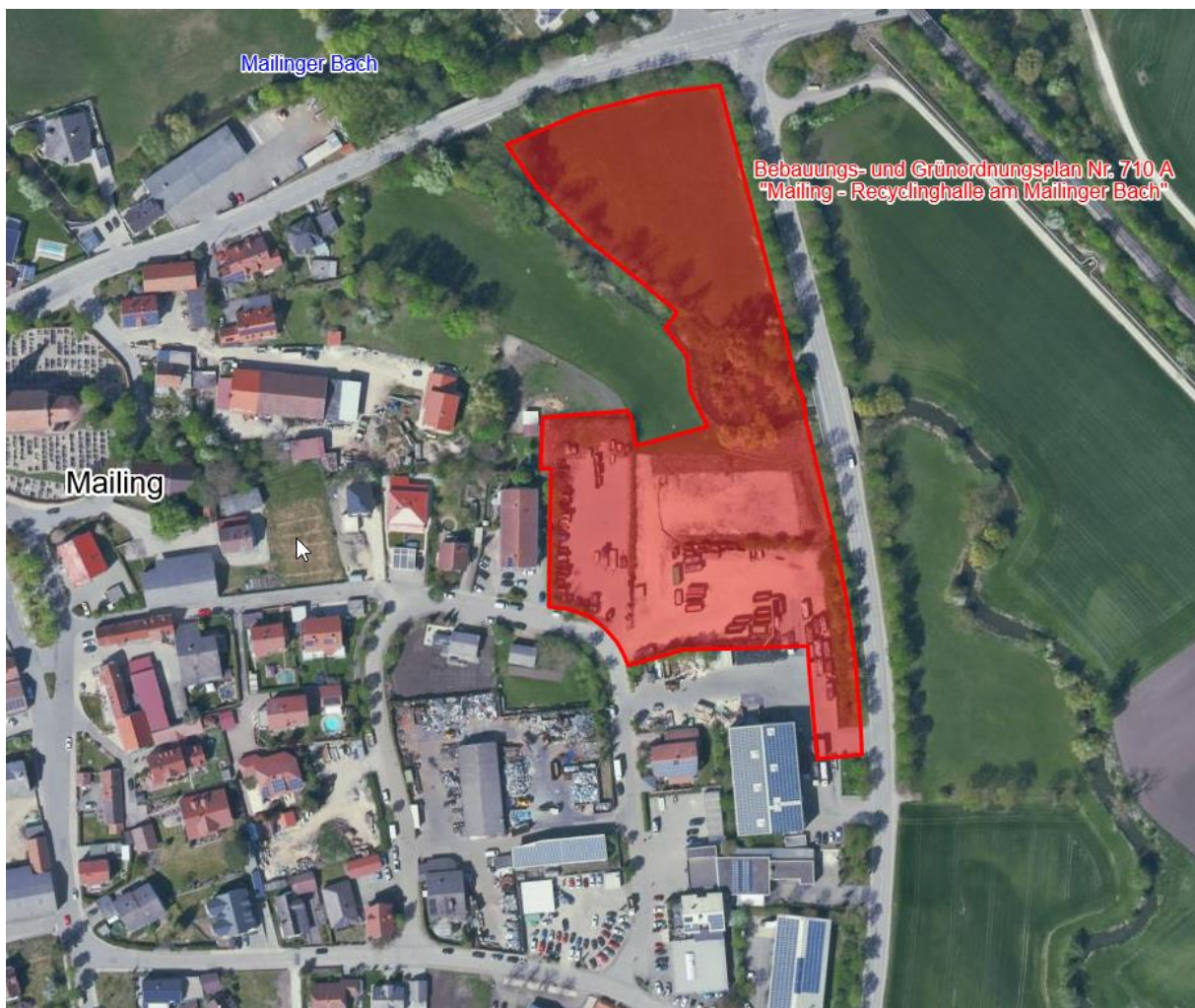
Abb. 1: Lage des Gewerbegebiets "Mailing – Recyclinghalle am Mailing Bach" in Mailing

Für die Maßnahme wurde durch das Büro ifb Eigenschenk aus Deggendorf mit Datum vom 20.11.2018 ein Baugrundgutachten erstellt. Im Rahmen der Baugrunduntersuchungen wurden unter dem Oberboden bzw. teilweise vorhandenen Auffüllungen überwiegend gemischtkörnige Flussablagerungen sowie fluviatile Kiese und Sande erkundet. Die k_f -Werte werden für die Flussablagerungen mit 1 \cdot 10^{-5} m/s bis 1 \cdot 10^{-11} m/s angegeben. Die darunter liegenden Kiese und Sande weisen Durchlässigkeitswerte von 1 \cdot 10^{-2} m/s bis 5 \cdot 10^{-7} m/s auf. An allen Erkundungsstellen wurde das Grundwasser in Tiefen zwischen 0,6 m und 1,5 m unter Geländeoberkante angetroffen. Aufgrund des geringen Grundwasserabstands ist eine Versickerung von Niederschlagswasser nicht möglich