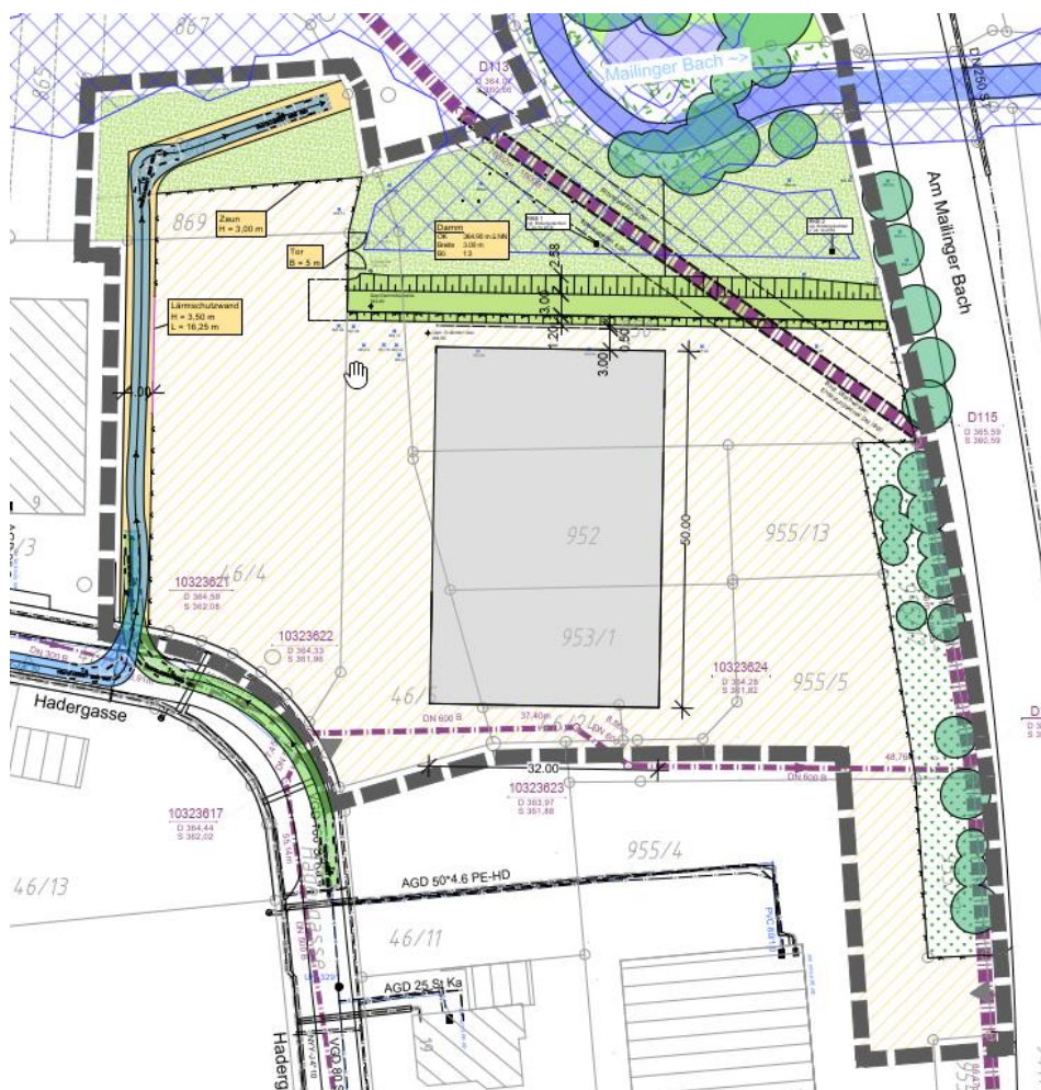
Abb. 2: Lageplan mit bestehenden Mischwasserkanälen (ohne Maßstab)

Im östlichen Bereich des Plangebietes verläuft ein Mischwasser-Entlastungskanal DN 1800 aus Beton. Zudem befindet sich am südlichen Rand des Geltungsbereichs ein Mischwasserkanal DN 600 aus Beton, welcher von der Hadergasse dem Entlastungskanal zuläuft. Das anfallende Schmutzwasser aus der Recyclinghalle sowie das Oberflächenwasser der Lager- und Fahrflächen wird in den bestehenden Kanal DN 600 eingeleitet. Vor der Einleitstelle wird ein Revisionschacht auf dem Baugrundstück hergestellt. Sofern erforderlich wird das Abwasser gedrosselt abgegeben und in einem Stauraumkanal zurückgehalten.