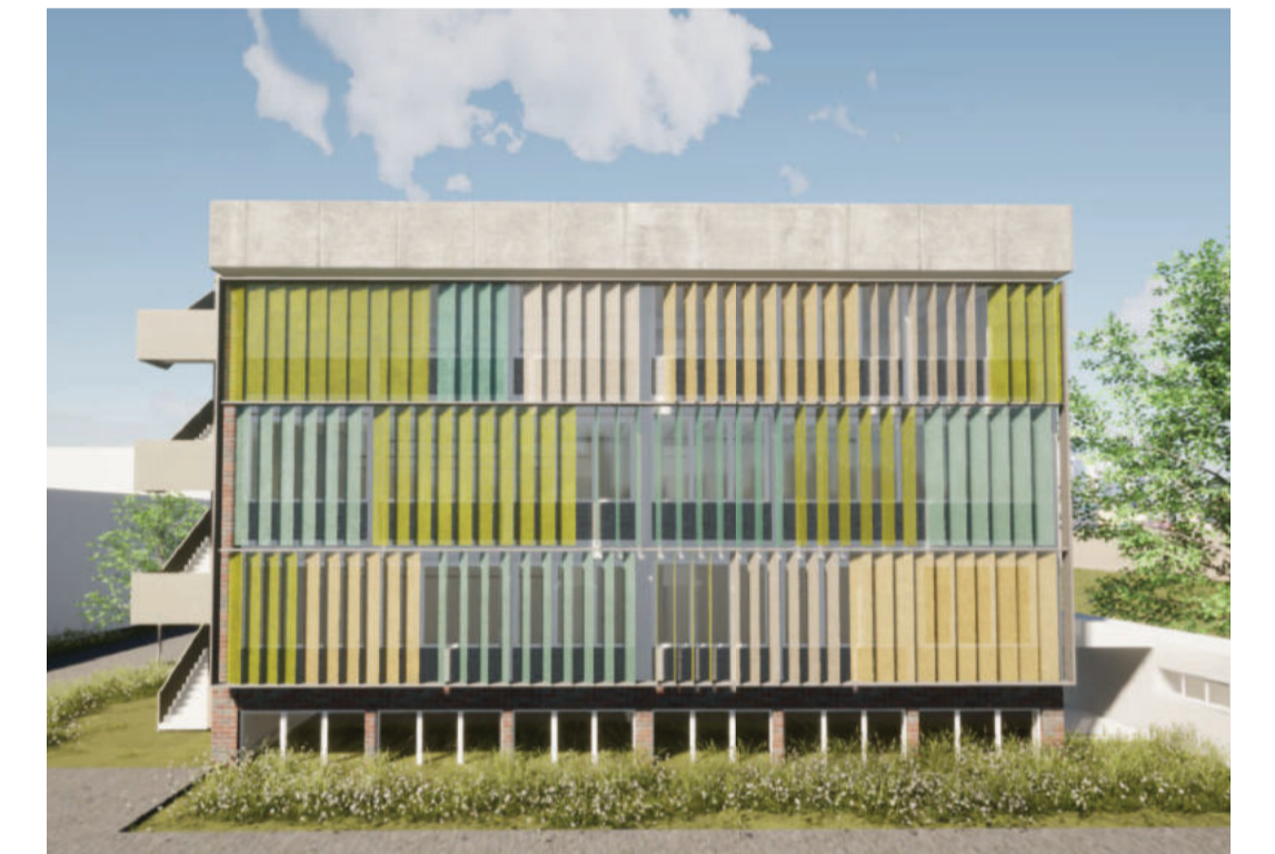
Vorschlag Sonnenschutz Drehlamellen