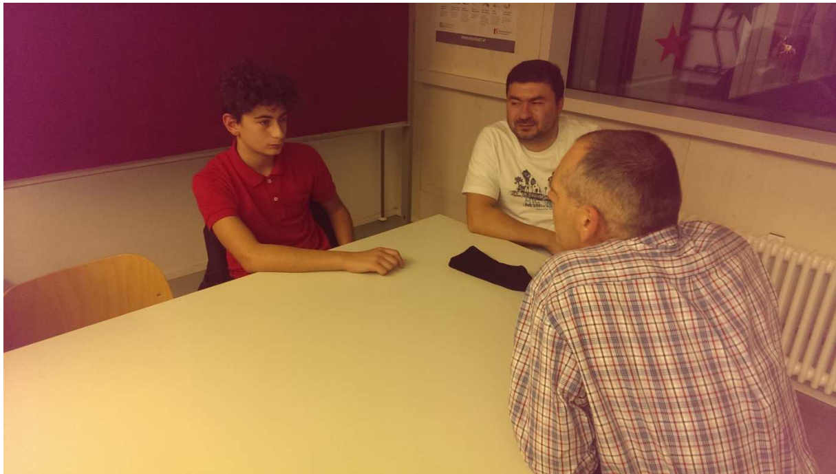
Speed-dating /Kennenlern-Runde: Schüler- Jobpate- Vater

Im Anschluss daran fand das sog „Speed-dating“ statt, wo alle Schüler die Möglichkeit hatten, alle Jobpatinnen und Jobpaten kennenzulernen und dann „ihren“ Jobpaten zu wählen bzw. .auszusuchen.