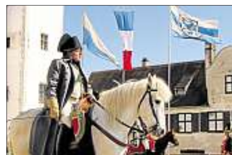
Napoleon kommt zurück ins Neue Schloss! Ab April 2015 steht Ingolstadt ganz im Zeichen der Bayerischen Landesausstellung „Napoleon und Bayern“.

Napoleon und das Jahr 2015 – da gibt es eine Verbindung. Im kommenden Jahr nämlich jähren sich die Niederlage Napoleons bei der legendären Schlacht bei Waterloo, seine endgültige Abdankung und Verbannung nach St. Helena zum 200. Mal. Das Jahr 1815 markierte das Ende einer mehr als 20 Jahre währenden Kriegsperiode in Europa. Bayern stand erst auf der Seite der Gegner Napoleons, und dann sein Verbündeter, und schließlich schwenkte es gerade noch rechtzeitig wieder auf die Seite der Gewinner. Einerseits brachte Napoleon Glanz, Ruhm und Modernität nach Bayern, andererseits aber auch Tod und Verderben. Auch zwischen Napoleon und Ingolstadt selbst gibt es eine Beziehung: Immerhin waren es die Truppen des Franzosen, die 1800/1801 die Landesfestung Ingolstadt zerstörten. Unter Ludwig I. wurden die vernichteten Festungswerke später wiedererrichtet. Weitere Informationen zur Landesausstellung unter www.hdbg.de/napoleon