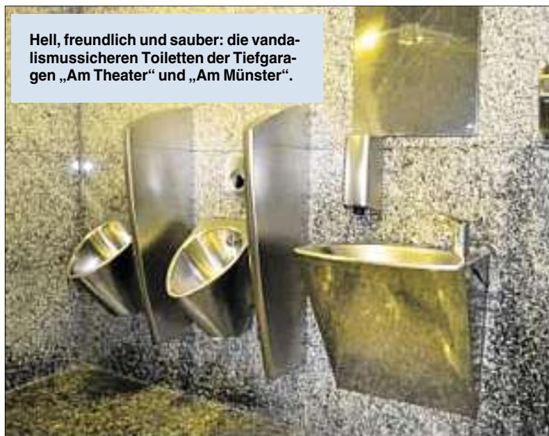
Hell, freundlich und sauber: die vandaliemussicheren Toiletten der Tiefgaragen „Am Theater“ und „Am Münster“.