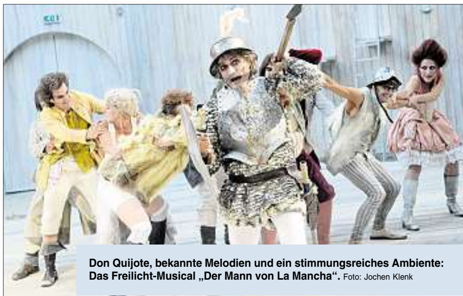
Don Quijote, bekannte Melodien und ein stimmungsreiches Ambiente: Das Freilicht-Musical „Der Mann von La Mancha“.

Und auch wenn momentan ein wenig Ruhe im Stadttheater einkehrt: Die Spielzeit 2014/2015 wirft bereits ihre Schatten voraus. Die Saison wird unter dem Motto „Ins Offene“ stehen und eine ganze Reihe interessanter Stücke beinhalten. So stehen unter anderem auf dem Programm: „Die Bremer Stadtmusikanten“, „Hamlet“, „Im weißen Rössl“ und „Mein Freund Harvey“ (siehe auch Infokasten). Darüber hinaus locken die Wiederaufnahmen (WA) be-