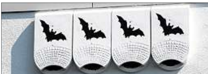
Seltene Unterkunft: Solche Fledermausquartiere sind ein willkommenes Zuhause für die fliegenden Säugetiere, die an modernen Glas- und Metallfassaden oft nicht mehr nisten können.

Um dieser Entwicklung entgegenzuwirken, installiert die GWG an ihren Gebäuden Nisthilfen für die bedrohten Arten. Darüber hinaus wurden in den Außenanlagen rund 150 Nistkästen für Sperling, Meisen, Kleiber und Dohle aufgehängt. Der Erfolg dieser Maßnahmen ließ sich innerhalb kürzester Zeit messen, denn nicht nur bei den Wohnungen der städtischen Tochter, sondern auch in den Nistkästen herrscht alljährlich „Vollbelegung“. Durch die außergewöhnliche Gestaltung der Grünflächen und Naturschutzprojekte schafft die Gesellschaft eine besondere Aufenthaltsqualität und leistet damit einen nennenswerten Beitrag zum „grünen“ Erscheinungsbild der Stadt Ingolstadt.