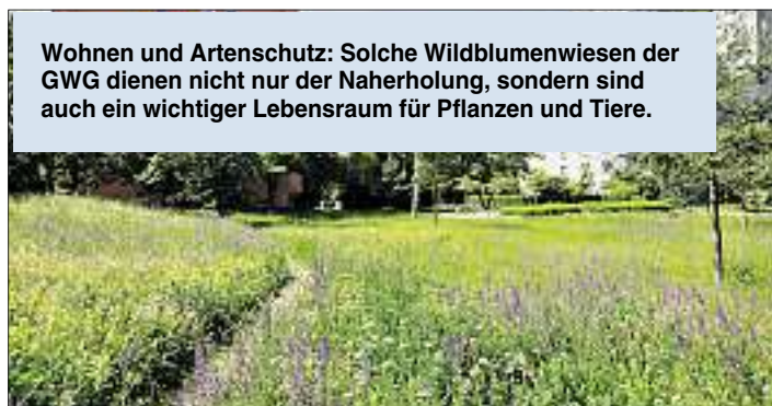
Wohnen und Artenschutz: Solche Wildblumenwiesen der GWG dienen nicht nur der Naherholung, sondern sind auch ein wichtiger Lebensraum für Pflanzen und Tiere.