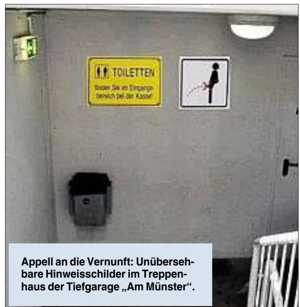
Appell an die Vernunft: Unübersehbare Hinweisschilder im Treppenhaus der Tiefgarage „Am Münster“.

Der Sommer ist da und es herrscht Leben in der Ingolstädter Altstadt: Biergärten, Bars und Kneipen laden zum Entspannen und zum Feiern ein. Nicht nur Nachtschwärmer finden ein vielfältiges Angebot vor. Das ist die schöne Seite der Innenstadt. Allerdings gibt es immer wieder auch Menschen, die durch ihr Verhalten einen Innenstadtbesuch in schlechtes Licht rücken: Es riecht nach Urin an manchen Ecken und Gebäuden. Nicht einmal das Ingolstädter Liebfrauenmünster ist vor den Wildpinklern sicher. Es mag einfach, praktisch und bequem vor allem für männliche Innenstadtbesucher sein, sich dort zu erleichtern. Aber allen anderen stinkt es zum Himmel – und zwar unnötigerweise. Denn öffentliche Toiletten sind meist nicht weit und ein wenig gute Kinderstube sollte man auch zu später Stunde nicht vergessen.