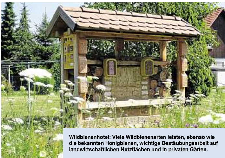
Wildbienenhotel: Viele Wildbienenarten leisten, ebenso wie die bekannten Honigbienen, wichtige Bestäubungsarbeit auf landwirtschaftlichen Nutzflächen und in privaten Gärten.

Naturschutz wird bei der GWG großgeschrieben