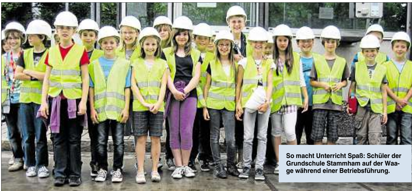
So macht Unterricht Spaß: Schüler der Grundschule Stammham auf der Waage während einer Betriebsführung.

Zudem kommen immer wieder Anfragen von älteren Schülern, die Seminar- oder Facharbeiten über Energieerzeugung oder thermische Verwertung schreiben. Auch sie werden von den Mitarbeitern der MVA gerne unterstützt. Durch das Engagement für junge Menschen habe sich die Akzeptanz der Anlage in der Bevölkerung verbessert, hat man bei der MVA festgestellt. Wer sie einmal besucht hat, dem wird schnell klar, dass die MVA als größter kommunaler Energieerzeuger längst ein wichtiger Bestandteil der Ver- und Entsorgungssicherheit des Standortes Ingolstadt geworden ist.