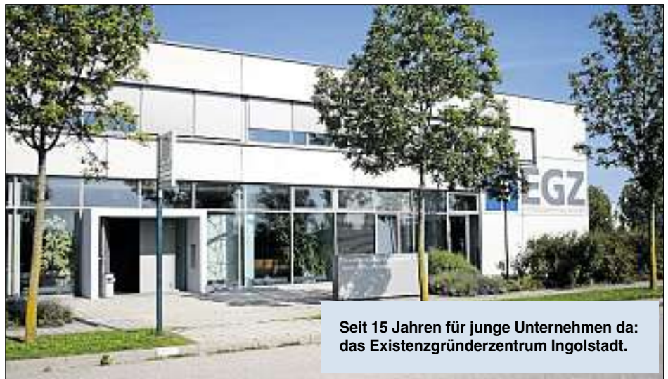
Seit 15 Jahren für junge Unternehmen das Existenzgründerzentrum Ingolstadt.