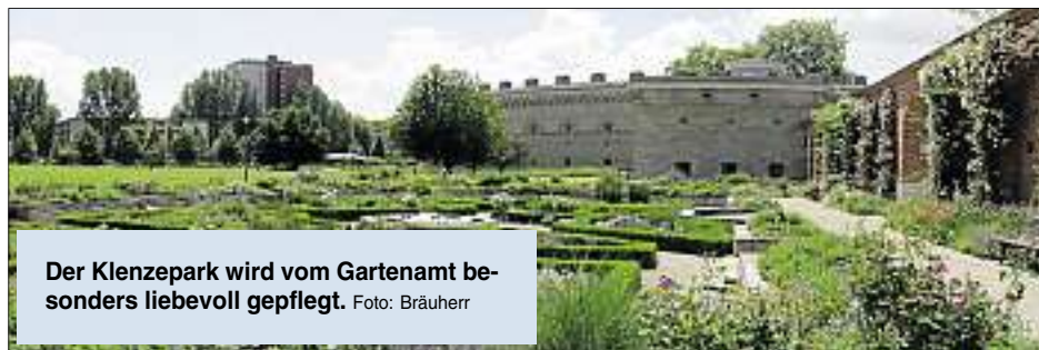
Der Klenzepark wird vom Gartenamt besonders liebevoll gepflegt.

Ein kleines Gedankenspiel: Was wäre, wenn es in unserer schönen Stadt kein Grün gäbe? Keine Bäume, keine Blumen, keine Pflanzen. Keine schön angelegten Parks, keine ruhigen Naherholungsgebiete ... Übrig bliebe ein tristes Grau, fad, eintönig, langweilig. Deprimierend wie ein Bild, dem die Farbe entzogen wurde – alles nur Schwarz-Weiß. Frustrierend wie dunkle Wolken am Himmel, aus denen unaufhörlich der Regen prasselt. Eine schreckliche Vorstellung!