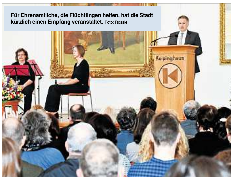
Für Ehrenamtliche, die Flüchtlingen helfen, hat die Stadt kürzlich einen Empfang veranstaltet.

„Die ehrenamtlichen Asylhelfer leisten einen unschätzbaren Dienst für die schutzsuchenden Menschen, die zu uns kommen“, betont Oberbürgermeister Christian Lösel. Das Stadtoberhaupt hatte kürzlich viele Ehrenamtliche eingeladen, um „Danke“ zu sagen. Im Rahmen der Veranstaltung im Spiegelsaal des Kolpinghauses erklärte Lösel: „Mit Ihrer Tätigkeit beweisen Sie nicht nur Verantwortungsbewusstsein und Mitmenschlichkeit. Sie beweisen auch Offenheit gegenüber Menschen aus an-