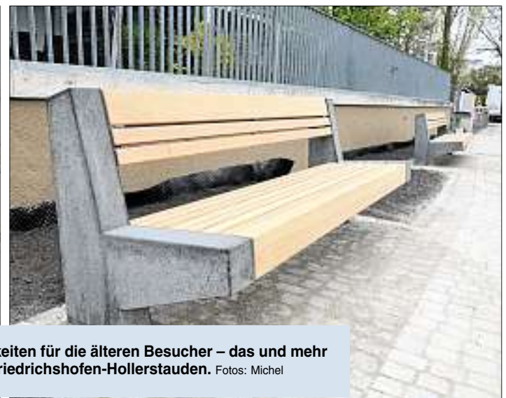
Spielflächen für die kleinen und Sitzmöglichkeiten für die älteren Besucher – das und mehr bietet der neu gestaltete „Brunnenplatz“ in Friedrichshofen-Hollerstauden.