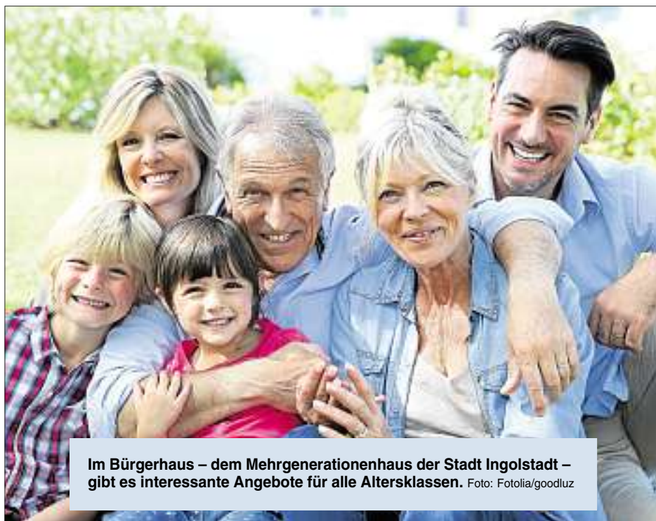
Im Bürgerhaus – dem Mehrgenerationenhaus der Stadt Ingolstadt – gibt es interessante Angebote für alle Altersklassen.

Die Mehrgenerationenhäuser sind ein Aktionsprogramm des Bundesfamilienministeriums. Die durchgeführte Erhebung ergab, dass die Gesamtzahl der Angebote in Ingolstadt achtmal höher ist als im bundesweiten Durchschnitt und sogar zehnmal höher als im bayerischen Durchschnitt. In den Bereichen „Bildung“ und „Freiwilliges Engagement“ liegt der Vergleichswert um fast das Dreifache höher. „Die Zahl der Nutzungen der generationsübergreifenden Angebote ist mit 1700 fast viermal so hoch wie im Durchschnitt“, sagt