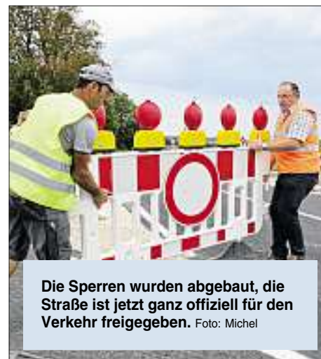
Die Sperren wurden abgebaut, die Straße ist jetzt ganz offiziell für den Verkehr freigegeben.

Der 1,5 Kilometer lange letzte Straßenabschnitt schlug mit Gesamtbaukosten von etwa 4,1 Millionen Euro zu Buche. Damit ist dieser Abschnitt auch der teuerste der gesamten Nordumgehung. Er trägt allerdings auch maßgeblich zur Entlastung von Etting und Wettstetten bei. Mit der Verkehrsfreigabe der Nordumgehung Anfang September wurde wegen umfangreicher Sanierungsarbeiten gleichzeitig nochmals die Staatsstraße El 18 zwischen Wettstetten und der Ostumgehung für etwa zwei Monate gesperrt. Die Umleitung erfolgt über den neuen Abschnitt der Nordumgehung. Und auch ein weiterer verkehrstechnisch wichtiger Schritt steht an: „Das nächste Projekt wird der vierspurige Ausbau der Ostumgehung Etting von Audi zur Autobahn. Die ersten Arbeiten dafür werden auf Höhe des Audi-Werks schon im kommenden Jahr beginnen“, verrät Lösel.