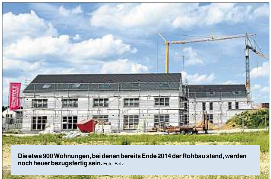
Die etwa 900 Wohnungen, bei denen bereits Ende 2014 der Rohbau stand, werden noch heuer bezugsfertig sein.

Doch auch jetzt liegen die Wohnungsbaugenehmigungen auf einem Rekordniveau. Gab es im Jahr 2007 noch für 651 Wohnungen eine Bauerlaubnis, so wa-