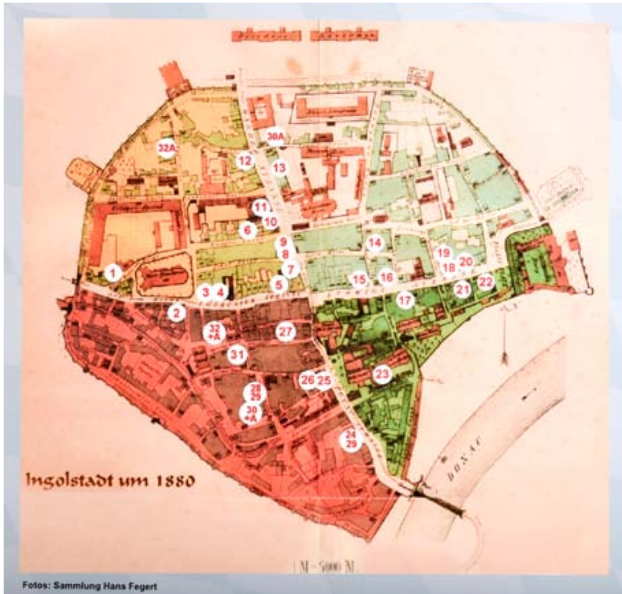
Ingolstädter Brauereien Anno 1880