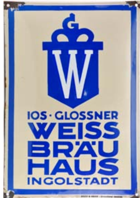
(Leihgabe von privatem Sammler B)