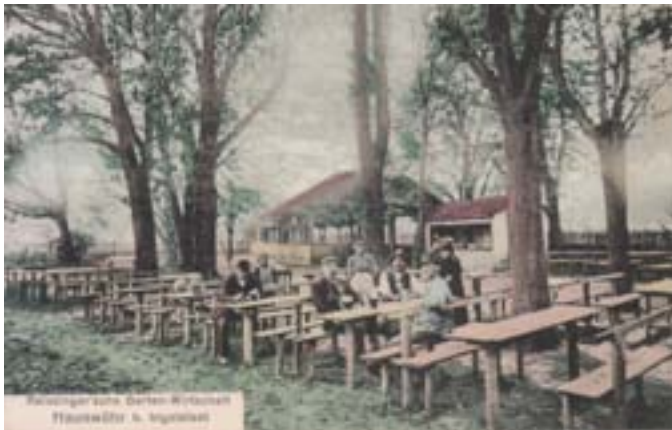
Der Bienengarten, um 1910

Außerhalb der Altstadt entstanden ebenfalls „Wirtsgärten“, welche zu beliebten Ausflugszielen an den Wochenenden wurden. So wanderte die ganze Familie zu Fuß kilometerweit in den „Sommerkeller“ nach Oberhaunstadt, zur „Antonius-schwaige“, zum „Donnersberger Gut“, zur „Reissinger'schen Garten-Wirtschaft“ in Haunwöhr, zur „Demlinger Hütte“ oder sogar zum „Högnerhäusl“ bei Wettstetten oder ins „Köschinger Waldhaus“.