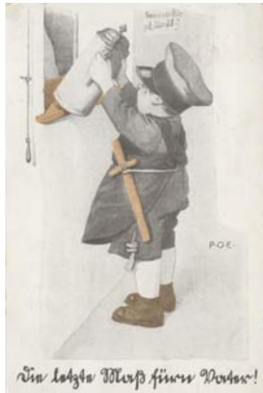
„Die letzte Maß für'n Vater“, Postkarte 1914