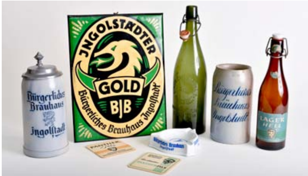
(Leihgaben von privaten Sammlern A, B und der Firma Herrnbräu)