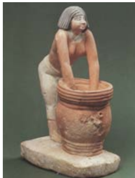
Statue einer Bierbrauerin, Ägypten 2350 v. Chr.

Auch im antiken Griechenland und im alten Rom gehörte Bierbrauen zum Alltag. Plinius der Ältere (23 – 79 n. Chr.) schreibt in seiner „Historia naturalis“ an mehreren Stellen vom Bier und erwähnt auch, dass es von den Bewohnern Galliens „Cerevisia“ (von Ceres, der Göttin des Getreides) genannt wird.