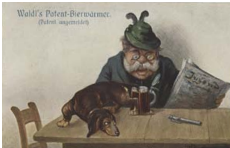
Waldi's Patent-Bierwärmer“, Postkarte um 1920

Der Dackel gehört zu Bayern wie die Berge, das Bier und die Weißwurst. Deshalb durfte er natürlich als Motiv im Grußkartensortiment nicht fehlen.