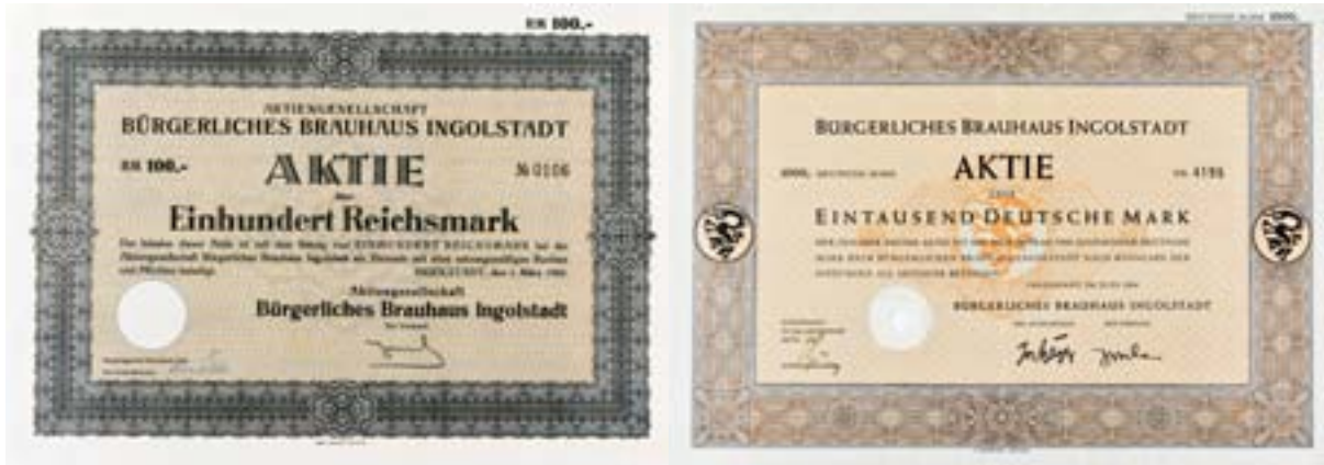
(Leihgaben der Firma Herrnbräu und von privatem Sammler D)