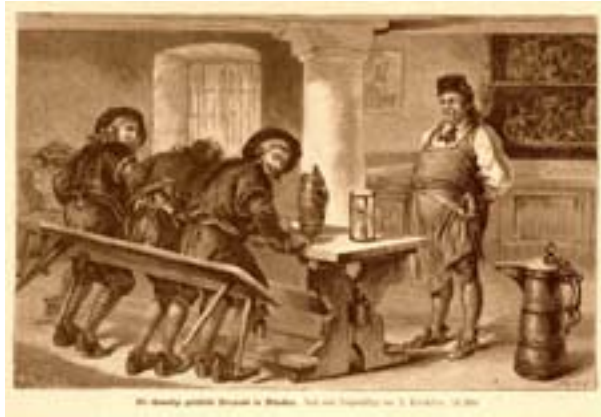
Gesetzliche Bierprobe, Holzstich aus dem Jahre 1887

Es gab zwar seit dem 12. Jahrhundert in diversen bayerischen Städten Verordnungen für das Brauen von Bier, aber es existierten keine einheitlichen Rechtsvorschriften für ganz Bayern.