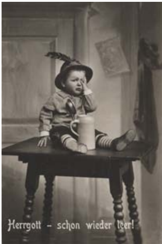
„Herrgott - schon wieder leer“, Postkarte um 1910