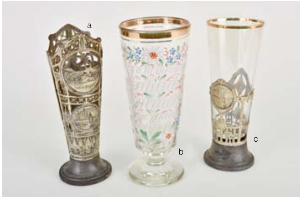
(Leihgaben von privatem Sammler A)