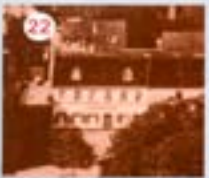
22. Franziskaner Klosterbräu