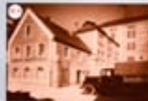
30 a Schöffbräu