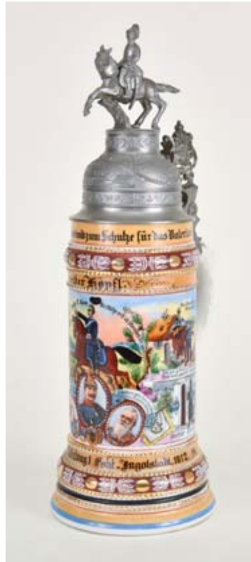
(Leihgabe Stadtmuseum Ingolstadt)

Die Krüge aus der Zeit vor 1900 waren meist noch klein und naiv bemalt. Nach der Jahrhundertwende wurden sie immer größer und prunkvoller. Nach 1918, also nach Beendigung des 1. Weltkriegs gab es dann fast keine Reservistenkrüge mehr. Erst ab 1933 tauchen wieder einfache kleine Krüge zur Erinnerung an die Dienstzeit auf. (siehe Nr. 52)