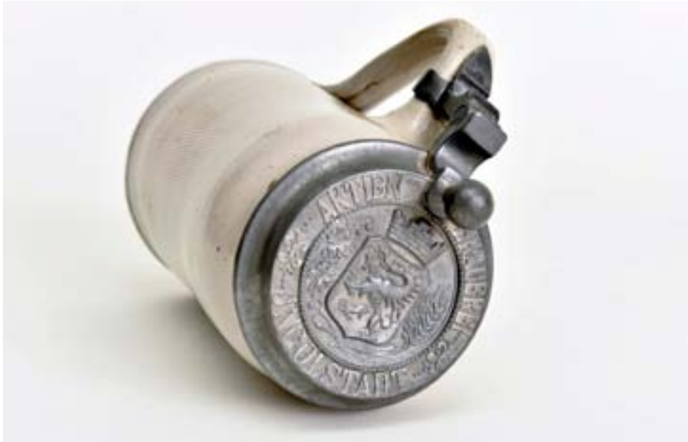
Handgearbeiteter Steinzeug-Maßkrug mit Zinndeckel, Aktienbrauerei Ingolstadt, zwischen 1873 und 1899 (Leihgabe von privatem Sammler B)

Allerdings war die Verwendung dieser Krüge mit hohen Kosten verbunden. Bei Bruch eines Kruges musste der Deckel aufwendig ummontiert werden. Die Deckel mussten in regelmäßigen Abständen mühevoll mit Zinnkraut geputzt werden, und das Waschen dieser Krüge war umständlich. Aus dem Umfeld des Münchner Kommerzienrates Georg Pschorr soll Ende der 1870er Jahre die Idee gekommen sein, deckellose Krüge zu verwenden, die den Namen „Keferloher“ erhielten (nach dem Viehmarkt auf Gut Keferloh bei München, den es schon im Jahr 955 gab).