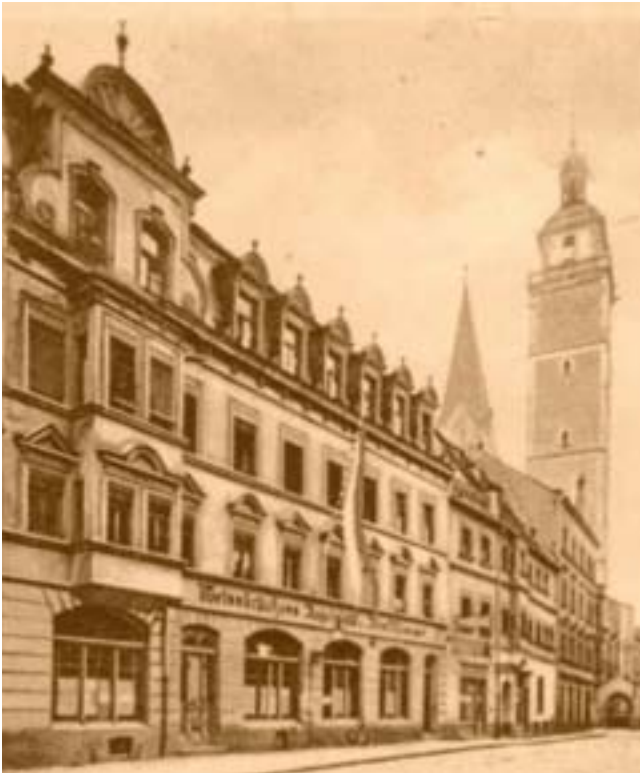
Das Weissbräuhaus, um 1900