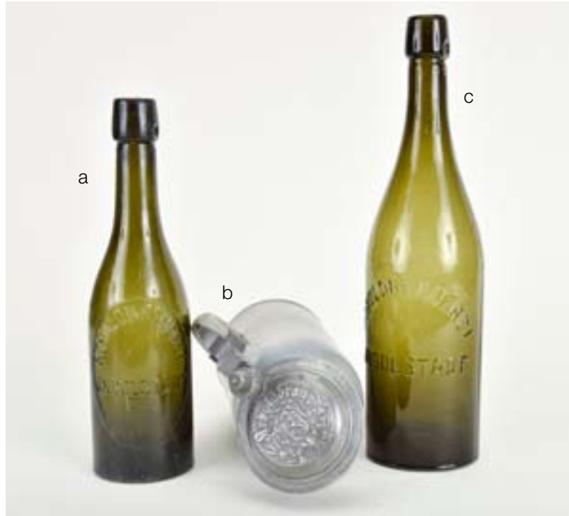
(Leihgabe von privatem Sammler B)