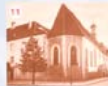
11. Gnadethal Klosterbrauerei