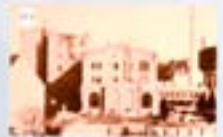
32.a Bürgerliches Brauhaus