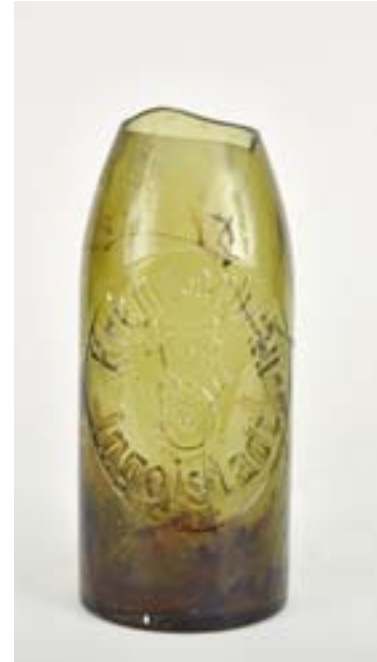
(Leihgabe von privatem Sammler B)