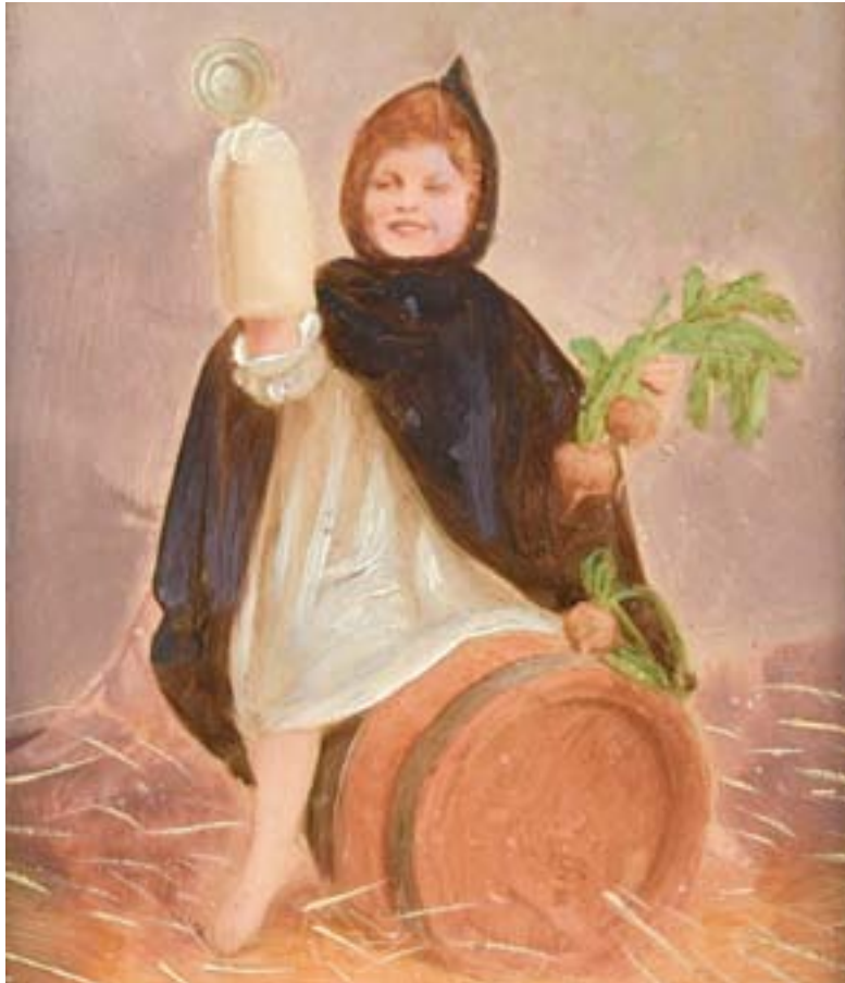
(Leihgabe von privatem Sammler C)