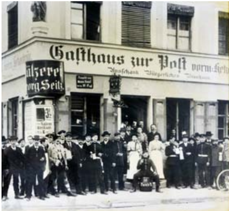
Das Hetzerbräugasthaus „Zur Post“ um 1910 (heute Galeria Kaufhof)

In der Garnison Ingolstadt dienten um 1900 etwa 6000 Soldaten. Es bestand also ein großer Absatzmarkt für Reservistenkrüge.