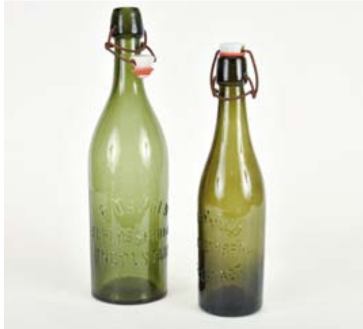
(Leihgaben von privaten Sammlern A und B)