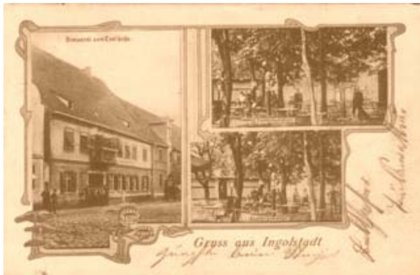
Grüßkarte von 1905 - Eselbräu mit Biergarten