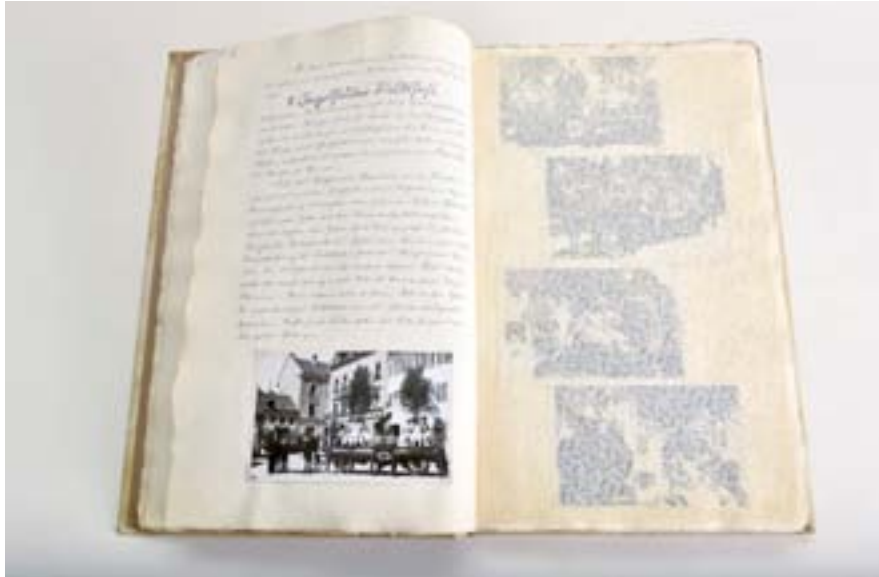
Chronik des Bürgerlichen Brauhauses von 1933-1936

1934 wurde das Volksfest erstmals auf dem „alten“ Volksfestplatz am Scherbelberg beim Taschenturm abgehalten. Hierzu findet sich in einer Chronik des Bürgerlichen Brauhauses folgender Eintrag: