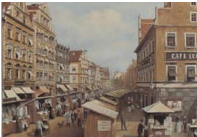
Markttag in der Ludwigstraße um 1910, Gemälde von Hans Werner

Sie wurden oft an einem kirchlichen Feiertag oder dem Festtag eines im Ort stark verehrten Heiligen abgehalten und waren wirtschaftlich bedeutsam, weil nicht nur die umliegenden Bauern Vieh und Agrarerzeugnissen zum Verkauf brachten und auch die örtlichen Händler dort vertreten waren, sondern auch weil sie von Fernkaufleuten besucht wurden und dadurch dem örtlichen (städtischen) Handwerk eine Absatzchance eröffnete und örtliche Spezialisierungen erlaubten.