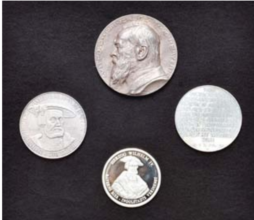
(Leihgaben Stadtmuseum Ingolstadt und von privatem Sammler A)