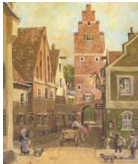
Ölbild von Hans Werner „Taschenturm mit Sternwirt“

Somit bestanden 1922 einschließlich der Gemeinde Oberhaunstadt, die damals eigenständig war, noch vier Brauereien.