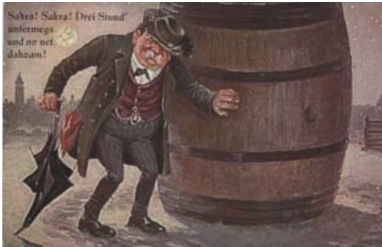
„Sakral Sakral“, Postkarte um 1930