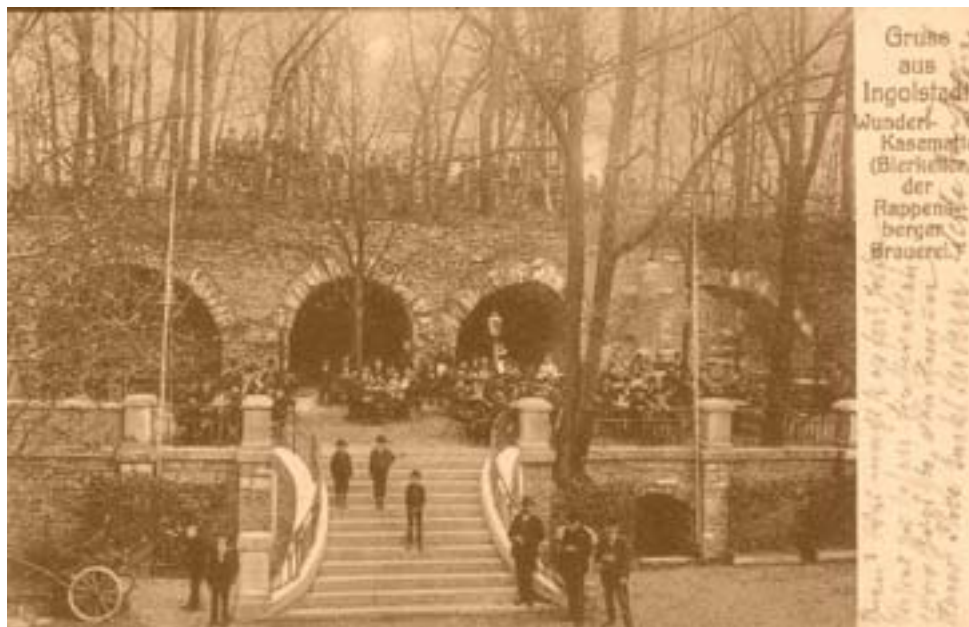
Biergarten der „Wunderl-Kasematte“ um 1905