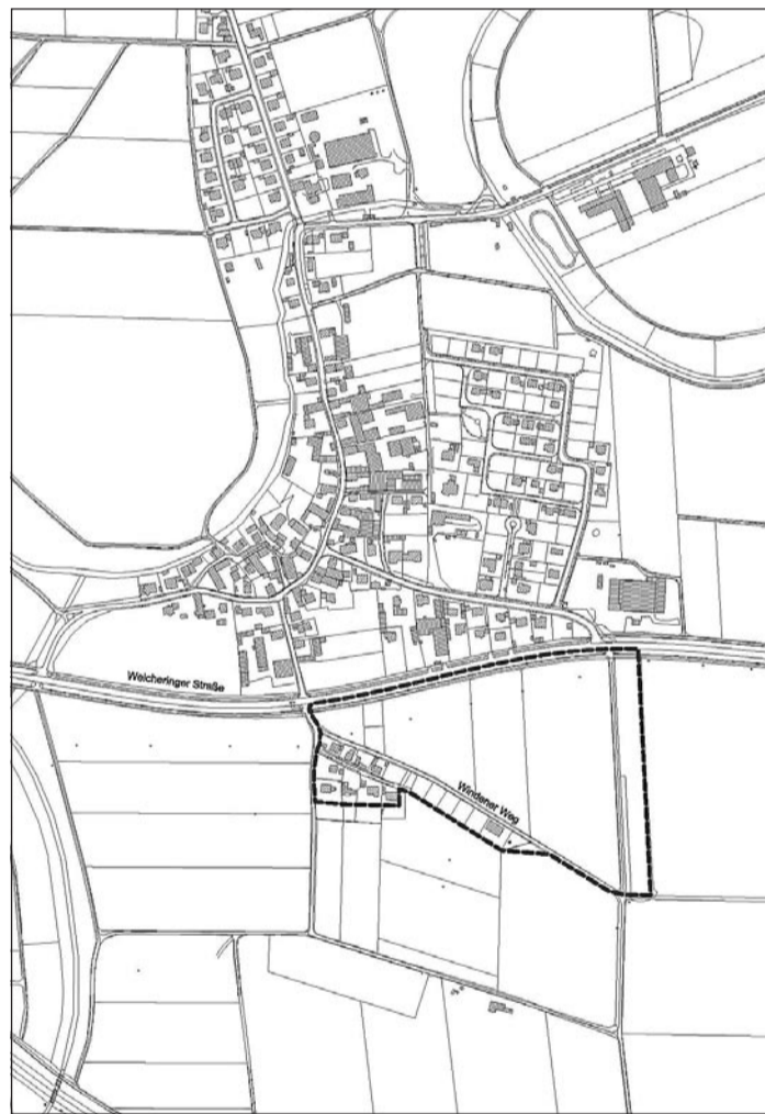
Lageplan zur Flächennutzungsplanänderung