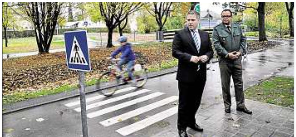
Ampeln und Zebrastreifen gibt es auch auf dem Gelände der Jugendverkehrsschule in Gerolfing. So lernen die Viertklässler, wie man sich sicher im Straßenverkehr bewegt.