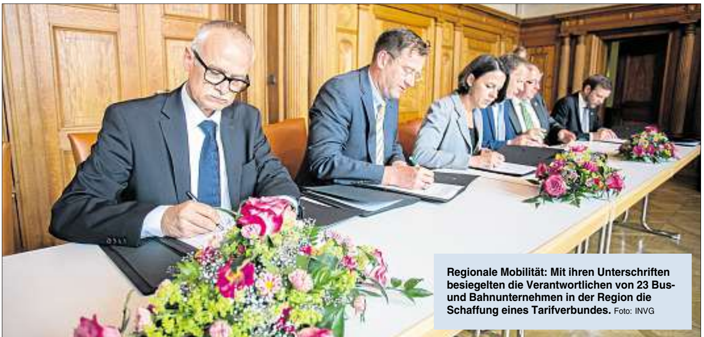
Regionale Mobilität: Mit ihren Unterschriften besiegelten die Verantwortlichen von 23 Bus- und Bahnunternehmen in der Region die Schaffung eines Tarifverbundes.

Mehrere Eisenbahngesellschaften und die Ingolstädter Verkehrsgesellschaft (INVG) haben sich in einem Abkommen darauf geeinigt, dass ab dem kommenden Fahrplanwechsel am 14. Dezember in allen Nahverkehrszügen im Großraum Ingolstadt die wichtigsten INVG-Fahrscheine anerkannt werden. Der gemeinsame Regionaltarif vereinfacht das Reisen und erhöht den Komfort für die Fahrgäste in der ganzen Region nochmals deutlich. Mit nur einem Fahrschein kann in Zukunft Bus und Bahn gefahren werden.