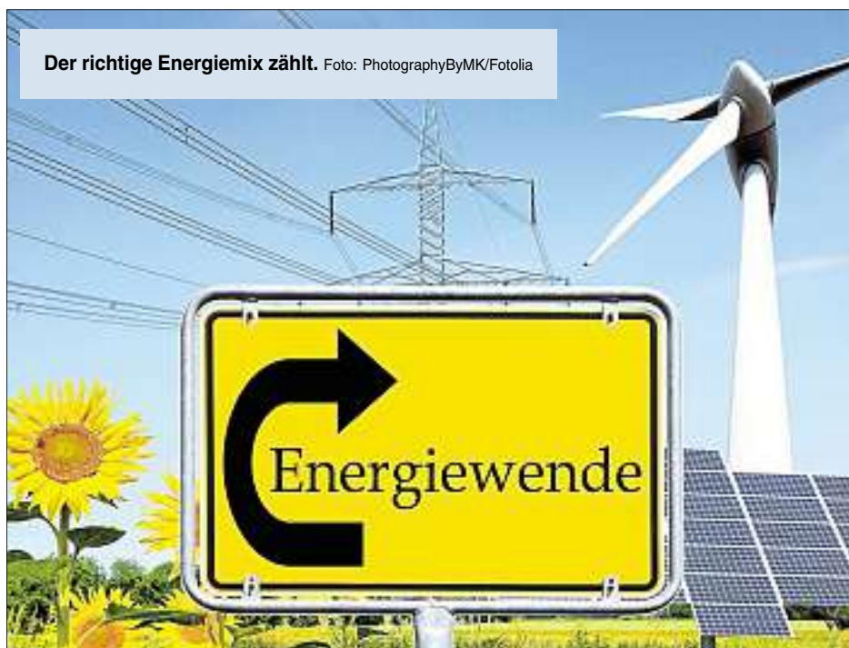
Der richtige Energiemix zählt.

Während Windkraft bei uns kaum Sinn macht und die Möglichkeiten der Wasserkraft ziemlich ausgeschöpft sind, sehen die Fachleute der TU München vor allem bei Photovoltaik und Geothermie/Wärmepumpen noch großes Potenzial. Jetzt müssen diese gewonnenen Erkenntnisse natürlich umgesetzt werden. „Dabei werden wir be-