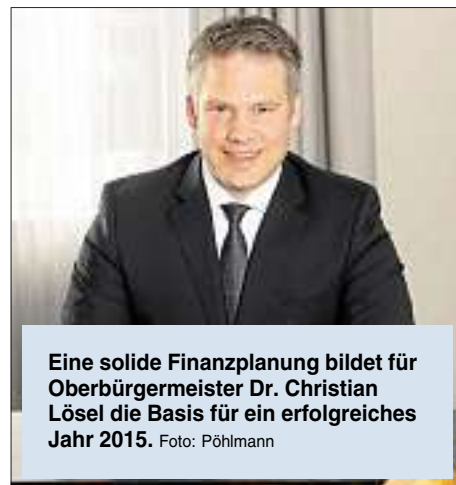
Eine solide Finanzplanung bildet für Oberbürgermeister Dr. Christian Lösel die Basis für ein erfolgreiches Jahr 2015.

Nicht unerwähnt ließ der Oberbürgermeister auch die Situation auf dem Wohnungsmarkt. Da Attraktivität der Stadt, Einwohnerzuwachs und dementsprechend auch die Wohnraum-Nachfrage weiter auf einem sehr hohen Niveau sind, reagiert die Stadt. So werden auch 2015 neue Baugebiete in verschiedenen Ortsteilen, unter anderem in Hagau und Pettenhöfen, ausgewiesen. Auch die restlichen Grundstücke für Reihenhäuser und Wohnhausgrundstücke in Friedrichshofen werden im kommenden Jahr zum Verkauf gestellt. Natürlich sind auch private Bauherren und Investoren in Ingolstadt enorm aktiv. Allein im vergangenen Jahr erteilte die Stadt Baugenehmigungen für 1318 Wohnungen, die überwiegende Zahl in Mehrfamilienhäusern. Seit 2011 ist der Bau von mehr als 3600 neuen Wohnungen genehmigt worden.