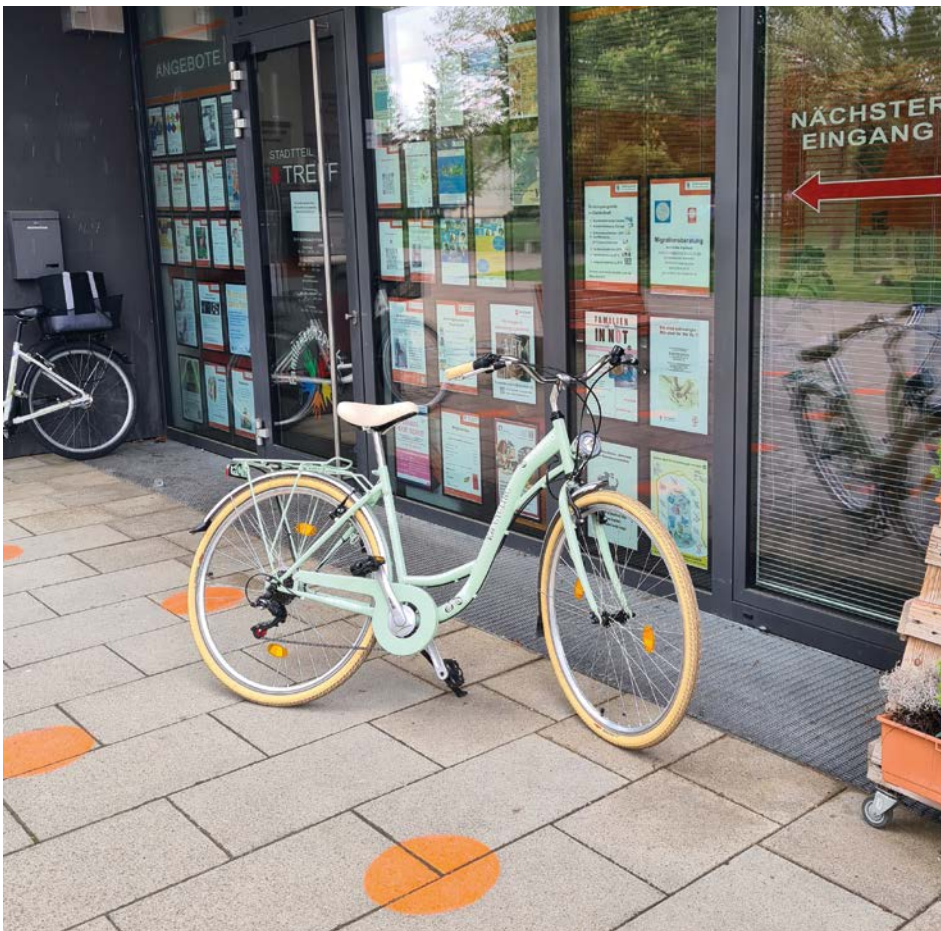
Auf zur Fahrradtour mit der „Engagierten Stadt“

Das Freiwilligenzentrum Ingolstadt, eine Kooperation zwischen dem Bürgerhaus der Stadt Ingolstadt und der Freiwilligen Agentur Ingolstadt e. V., bietet Beratung rund ums Thema Engagement – für Bürger/-innen, die ein Ehrenamt suchen, genauso wie für Organisationen, die Freiwillige suchen. Vereine erhalten Unterstützung, zum Beispiel durch bedarfsgerechte Schulungen oder auch bei rechtlichen Fragen; ein Newsletter informiert regelmäßig über Neues rund ums Ehrenamt in Ingolstadt und darüber hinaus. Über die Ehrenamtskarte und „Dein Engagement ist IN“ gibt es attraktive Vergünstigungen und besondere Aktionen für freiwillig Engagierte. Weitere Informationen sowie Ansprechpartnerinnen finden Sie unter www.freiwilligenzentrum-ingolstadt.de . Das Team des Freiwilligenzentrums freut sich über Ihre Kontaktaufnahme.