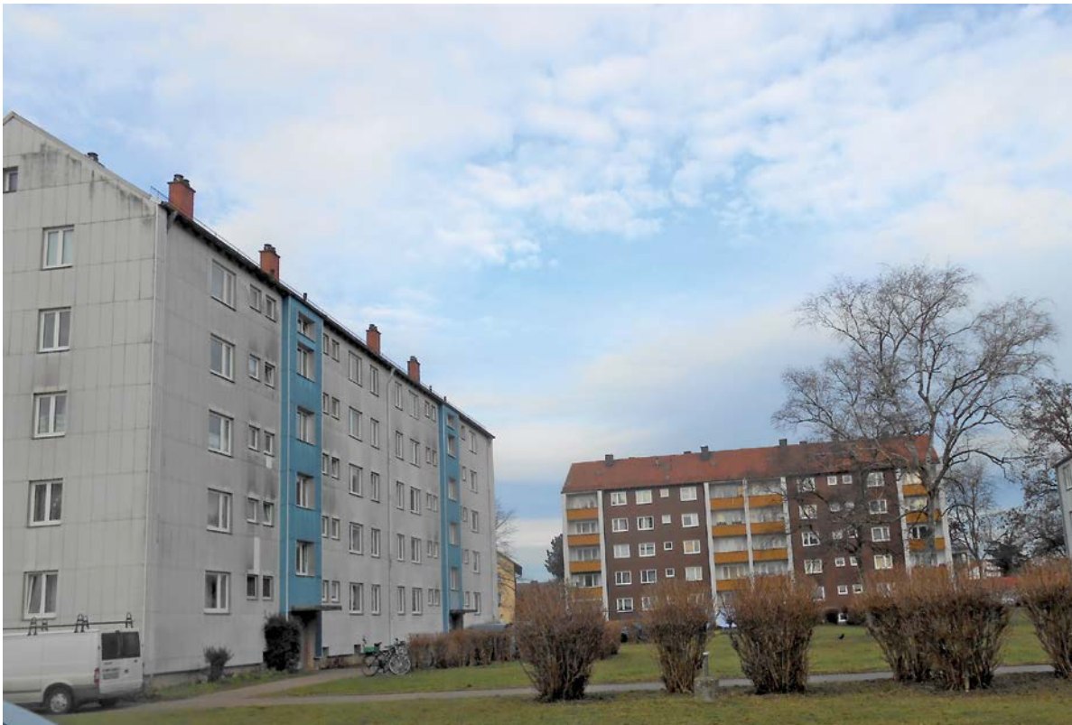
Leharstraße 24-26 vor der Sanierung