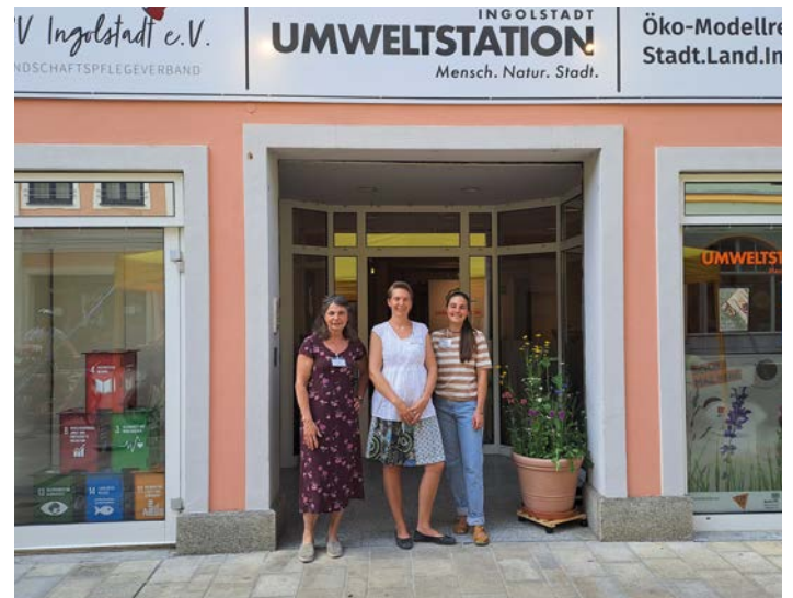
Das Team der Umweltstation vor den Räumen in der Ludwigstraße