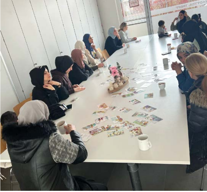
Im Familiencafé erhalten die Eltern wichtige Informationen

Her pazartesi öğleden sonra, aile kulübü aileleri açık ve rehberli bir ortamda birlikte öğrenmeye, oynamaya, şarkı söylemeye, dans etmeye ve deney yapmaya davet ediyor. Her buluşmada, bir eğitmeni olan deneyimli kurs liderimiz tarafından özenle seçilen yeni bir eğitim teması işlenmektedir. Sadece kayıt yaptırın, biz de el işi malzemelerini ve aktiviteleri buna göre hazırlayalım.