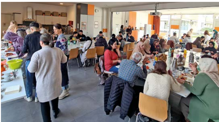
Mehr als vierzig Gäste kamen zum Interkulturellen Frühstück und brachten Köstlichkeiten aus ihrer Heimat mit

Seit den 1970er Jahren werden rund um dieses Datum weltweit die Wochen gegen Rassismus und Diskriminierung begangen.