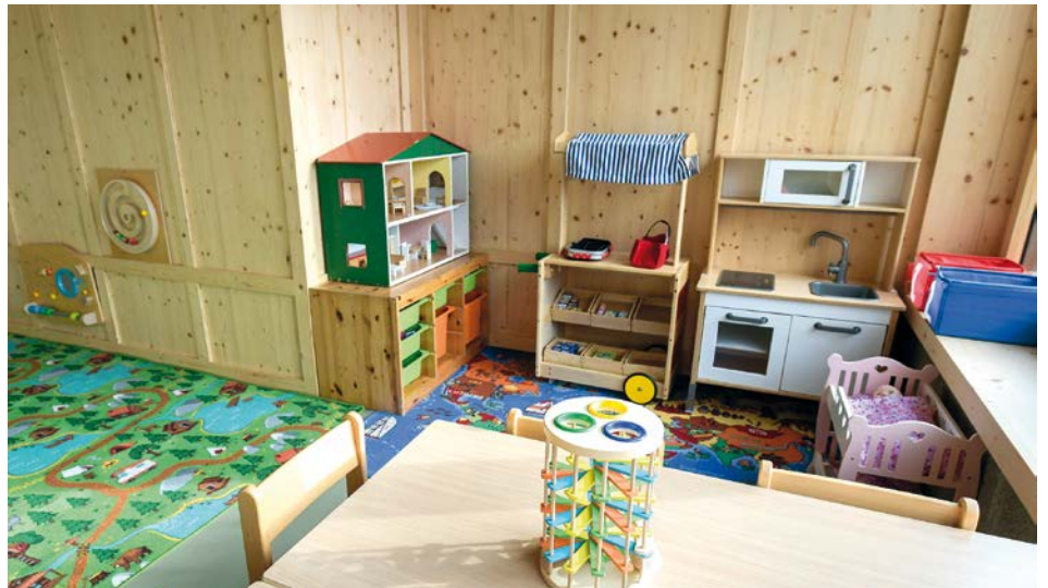
Der Bewegungsraum bietet genügend Platz für Entspannungs- und Sportangebote. Zudem können ihn Spielgruppen für ihre Treffen nutzen, da er auch mit einer Spielecke und Krabbelteppichen ausgestattet ist