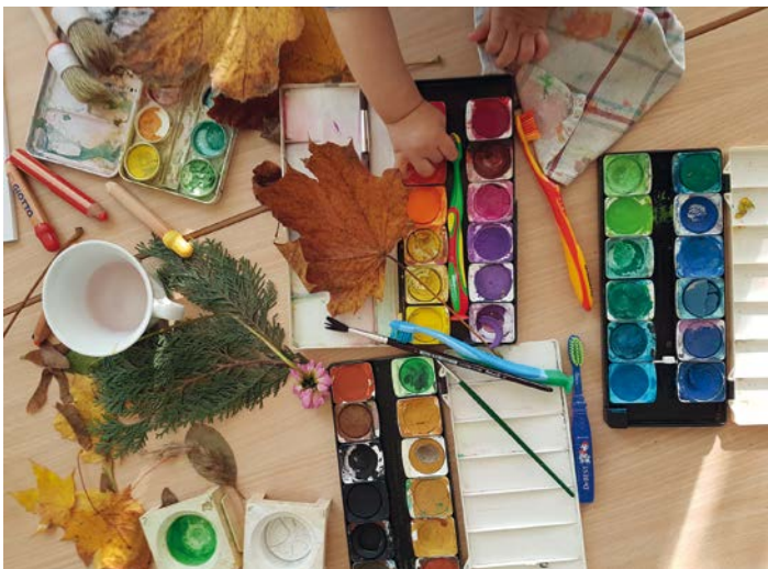
Im Familiencafé ist es immer richtig bunt

In der Familienprechstunde (immer mittwochs im Stadtteiltreff zwischen 10 und 11 Uhr, nach Vereinbarung) dürfen sich alle Eltern willkommen fühlen, denen Fragen rund um den Familienalltag auf dem Herzen brennen oder die vielleicht einfach nur Infos zu Angeboten im Stadtviertel suchen.