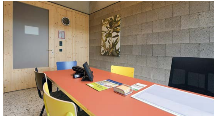
Moderner Besprechungsraum im neuen Treff