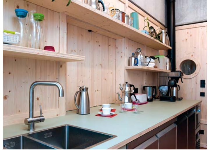
Die Küche mit Durchreiche zum Veranstaltungsraum ist für unterschiedliche Nutzungen geeignet

Gudrun Schmachtl Augustin Senti Semt Buluşma Ofisi