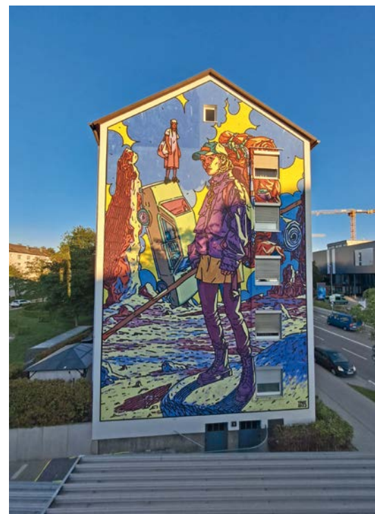
Die Fassade des Gebäudes Manchinger Straße 8 leuchtet jetzt in allen Farben