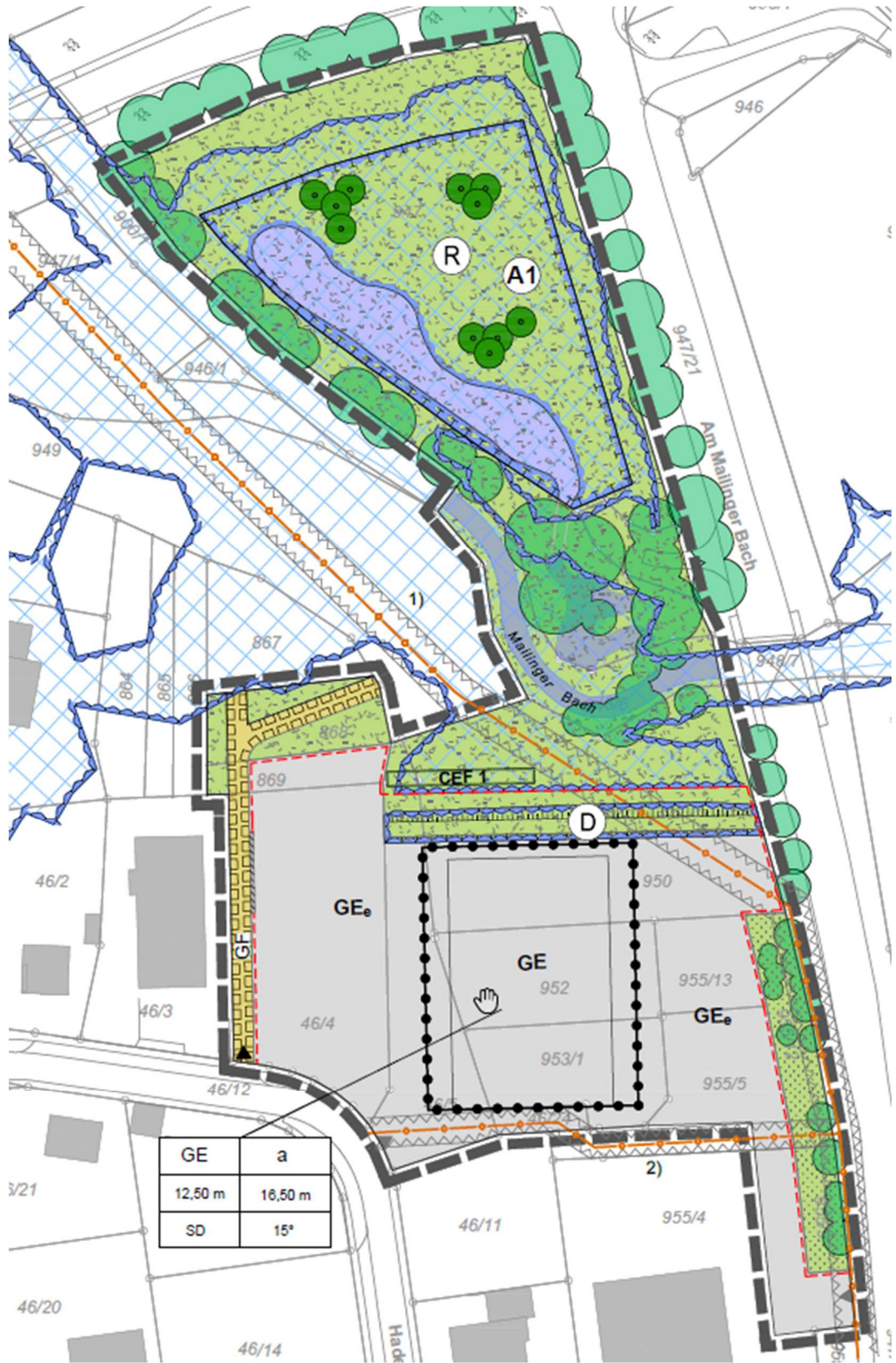
Abbildung 2: Plangrafik Entwurfsgenehmigung