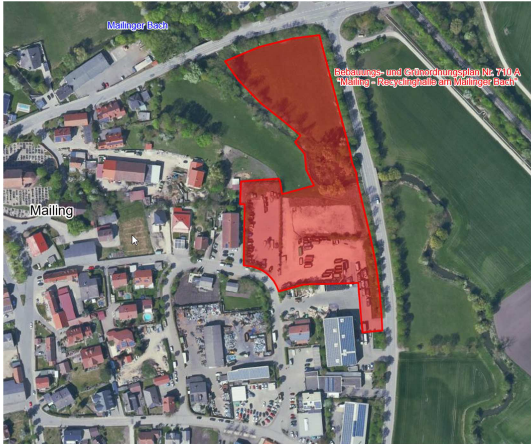
Abbildung 1: Lage des Gewerbegebietes "Mailing - Recyclinghalle am Mailinger Bach" in Mailing (ohne Maßstab)

Für die Maßnahme wurde durch das Büro IFB Eigenschenk aus Deggendorf mit Datum vom 20.11.2018 ein Baugrundgutachten erstellt. Im Rahmen der Baugrunduntersuchungen wurden unter dem Oberboden bzw. teilweise vorhandenen Auffüllungen überwiegend gemischtkörnige Flussablagerungen sowie fluviatile Kiese und Sande erkundet. Die k_f -Werte werden für die Flussablagerungen mit 1 \cdot 10^{-5} m/s bis 1 \cdot 10^{-11} m/s angegeben. Die darunter liegenden Kiese und Sande weisen Durchlässigkeitswerte von 1 \cdot 10^{-2} m/s bis 5 \cdot 10^{-7} m/s auf. An allen Erkundungsstellen wurde das Grundwasser in Tiefen zwischen 0,6 m und 1,5 m unter Geländeoberkante angetroffen. Aufgrund des geringen Grundwasserabstands ist eine Versickerung von Niederschlagswasser nicht möglich.