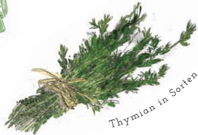
Thymian in Sorten