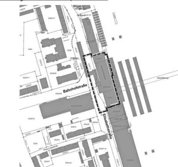
Lageplan zum vorhabenbezogenen Bebauungs- und Grünordnungsplan Nr. 109 N „Hauptbahnhof“

Die Verarbeitung personenbezogener Daten erfolgt auf Grundlage der Art. 6 Abs. 1 Buchstabe e DSGVO i. V. m. § 3 BauGB und dem BayDSG. Weitere Informationen entnehmen Sie bitte dem Formblatt „Datenschutzhinweise im Bauleitplanverfahren“, welches im Internet unter www.ingolstadt.de/bauleitplanverfahren abrufbar ist.