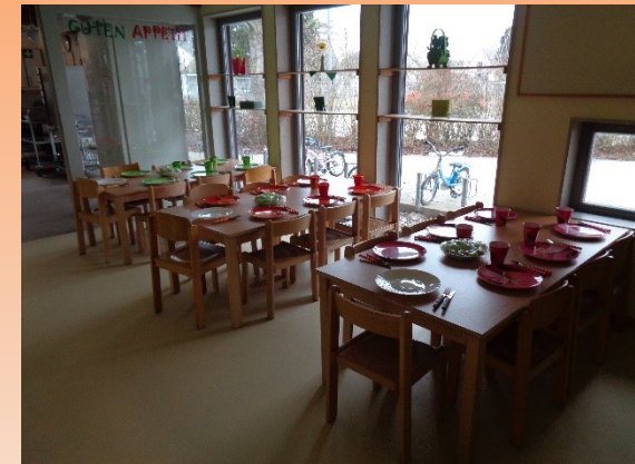
Brotzeit- und Mittagessensbereich