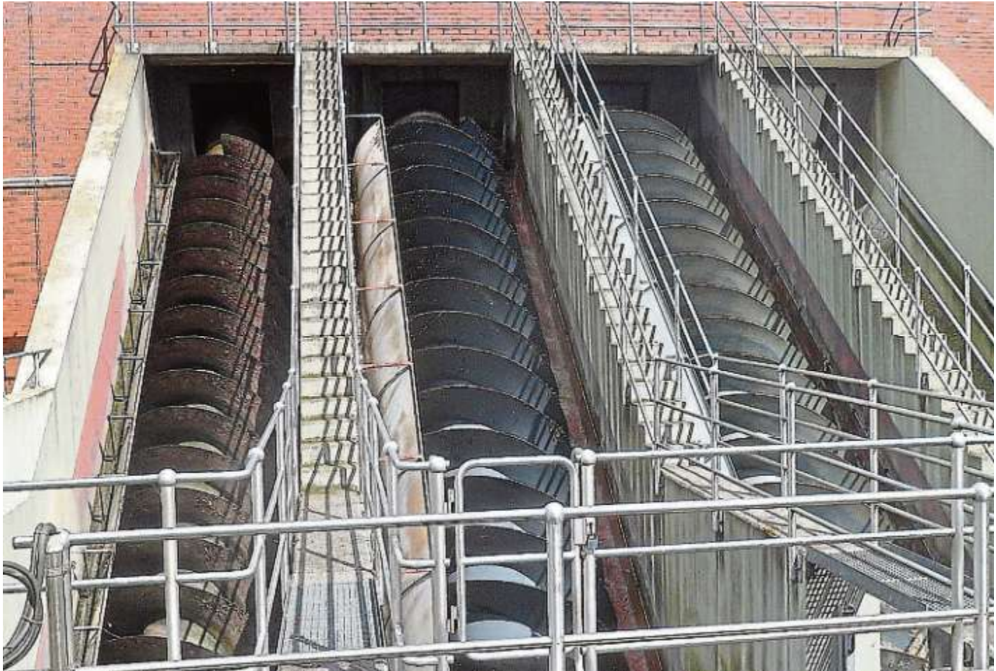
Technisches Wunderwerk: Die Schneckenpumpen am Einlaufhebewerk der Zentralkläranlage Ingolstadt (ZKA)

Eine geniale Erfindung für die Abwassertechnik