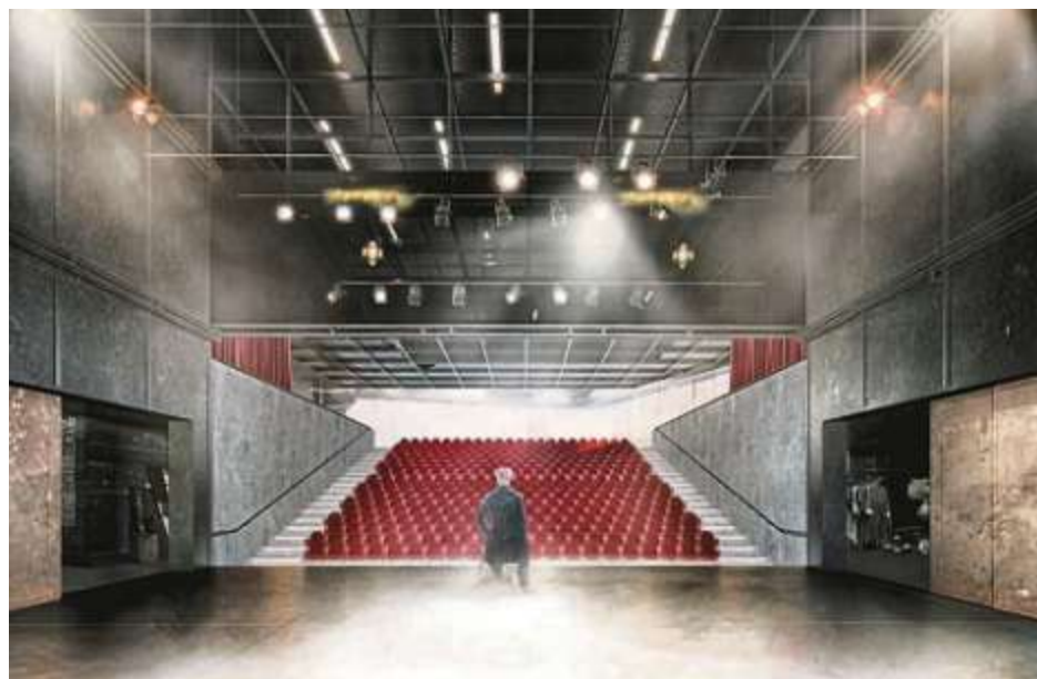
Herzstück der Kammerspiele wird der Theatersaal – für den Regelbetrieb als „Kleines Haus“ stehen dann etwa 250 Sitzplätze zur Verfügung.

vorplatz mitbearbeitet. Geplant ist eine Umgestaltung der Schutterstraße und eine Öffnung zur Donau hin. „Ich bin froh, dass nach Jahren der Planung und intensiven Prüfung nun ein Beschluss für die Kammerspiele gefasst werden konnte. Die Kammerspiele sichern nicht nur die Spielmöglichkeiten für das Stadttheater während der Sanierung, wir bekommen auch einen dauerhaften Kulturort in einem architektonisch sehr attraktiven Gebäude. Damit stärken wir nicht nur die örtliche Kulturszene, sondern auch die gesamte Innenstadt. Der Standort ermöglicht uns eine Öffnung zur Donau hin und eine Neugestaltung des Umfelds“, freut sich Oberbürgermeister Christian Scharpf.