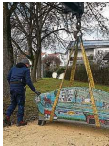
Aus Mitteln des Bürgerhaushalts wurde ein „Social Sofa“ mit Motiven aus dem Ortsteil gestaltet und aufgestellt.

Ab dem Jahr 2022 stehen dem BZA 75.000 Euro pro Jahr zur Verfügung. Aus dem Bürgerhaushalt wurden in den vergangenen Jahren im öffentlichen Raum viele Bänke und Sitzgruppen aber auch Spieleräte in den Grünflächen, Baumpflanzungen und Maßnahmen zur Verkehrsberuhigung finanziert. Verschiedene Abteilungen des VfB Friedrichshofen (Kegeln, Cricket...) erhielten finanzielle Unterstützung. In Erwartung der künftigen Ortserweiterung in Richtung Westen wurde schon jetzt die Umgestaltung nicht mehr genutzter Tennisplätze beim VfB Friedrichshofen in ein