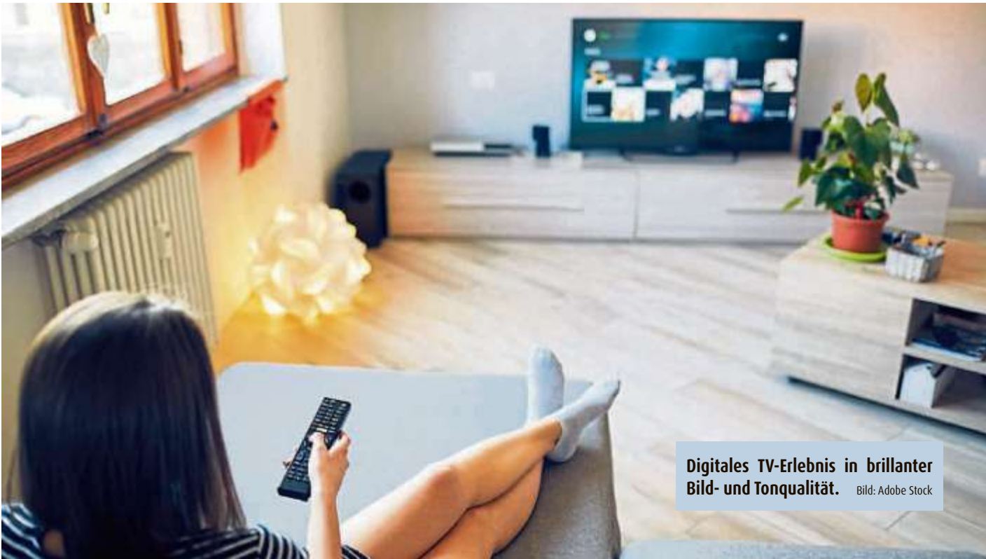
Digitales TV-Erlebnis in brillanter Bild- und Tonqualität.