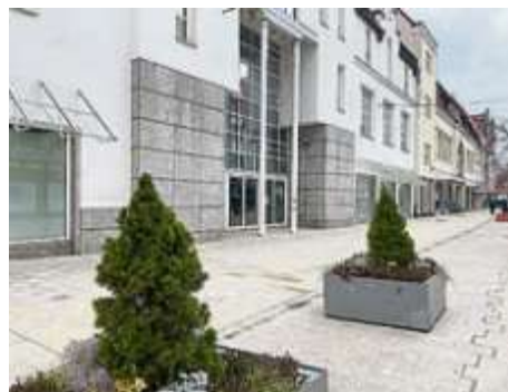
Das Kaufhof-Areal in der Innenstadt wird komplett neu geplant mit einer Mischnutzung aus Einzelhandel, Wohnen und Büros.