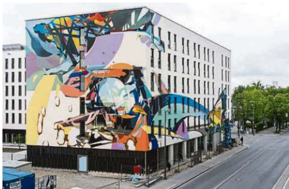
Der Künstler „SatOne“ hat in München unter dem Titel „Collision“ diese Hauswand gestaltet. Ab dem Frühjahr ist der Künstler auch in Ingolstadt unterwegs.

ist der Stadtjugendring Ingolstadt in Kooperation mit dem Kulturreferat der Stadt Ingolstadt. Einige Hauswände stellt die Gemeinnützige Wohnungsbaugesellschaft (GWG) zur Verfügung. Finanziell unterstützt wird das Projekt durch die Sparkasse Ingolstadt Eichstätt. Weitere Details und die Vorstellung der jeweils eingeladenen Künstler sind zukünftig auf www.landmarks-project.com zu finden.