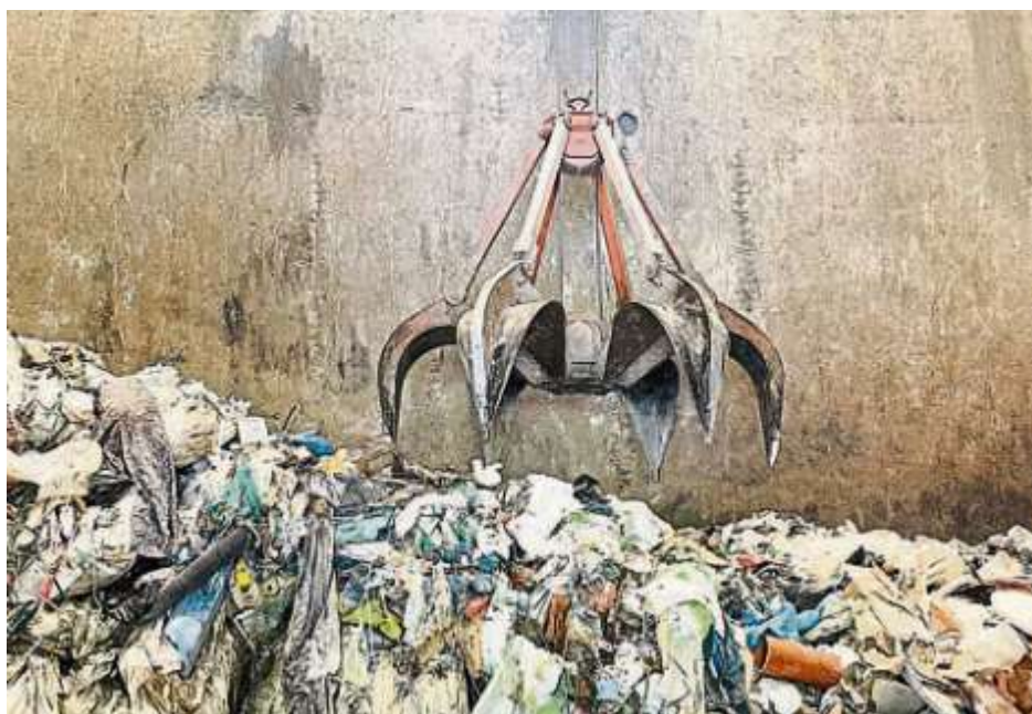
Nicht alles was im Bunker der MVA landet gehört auch dort hinein.

Manche Funde können aber auch eine erhebliche Brandgefahr darstellen, wie z. B. eine größere Menge in Umzugskartons verpackte Streichhölzer. Hier konnte ebenfalls durch die Aufmerksamkeit der Mitarbeiter Schlimmeres verhindert werden. Große und sperrige Gegenstände können