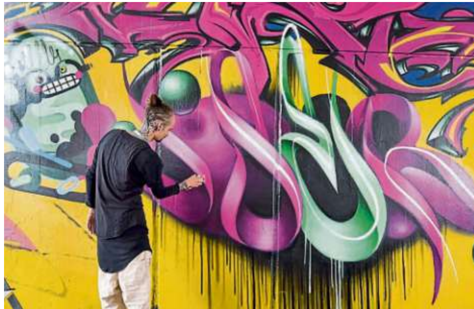
Graffiti-Kunst hat in Ingolstadt eine lange Tradition, zum Beispiel bei der „Grande Schmierage“. An der Bahn-Unterführung in Unsernherrn entstehen dabei tolle Kunstwerke.

Der Startschuss von „LANDMARKS“ fällt im Mai/Juni 2022 mit der Gestaltung der Giebel-Wand an der Ecke Münchener Straße / Prinz-Franz-Straße durch „SatOne“. Hierbei stehen zeitgenössisches Denken, technische Brillanz bei der Ausführung und das