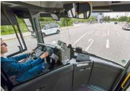
Der ÖPNV in Ingolstadt und der Region bekommt durch ein Bundes-Förderprogramm 29 Millionen Euro – damit werden deutliche Verbesserungen möglich.