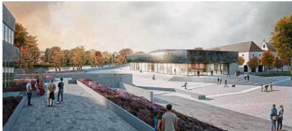
Optisch fällt bei den neuen Kammerspielen gegenüber dem Stadttheater vor allem die großzügige Glasfront der Fassade auf.

Die Gesamtmaßnahme besteht aus der Errichtung der Kammerspiele westlich des Theaters (24,8 Millionen Euro Fördermittel vom Freistaat, 17,6 Millionen Euro Eigenanteil der Stadt), der Errichtung von Werkstätten südlich und östlich des Stadttheaters (5,3 Millionen Euro Förderung, 3,3 Millionen Euro Eigenanteil) sowie der Freiraumgestaltung im direkten Umfeld der neuen Gebäude. Gebaut werden die Kammerspiele im Bereich der Tränkstorstraße über der Tiefgarage „Theater West“. Geplant ist ein Gebäude auf einer terrassenartigen Stufenanlage, unter der sich Teile der Nutzfläche befinden. Das Herzstück der Kammerspiele ist der Theatersaal. Das im Erdgeschoss vorgeschaltete Foyer ist als Hauptfassade mit den Eingängen sowohl der Donau als auch dem Theaterplatz zugewandt. Der Bodenbelag im Außenraum wird optisch in das Foyer weitergeführt und die verglaste Fassade verstärkt den fließenden Übergang des öffentlichen Raums in die Kammerspiele. Ziel der Erschließung ist, eine vielseitige öffentliche Nutzung des Foyers und des Theatersaals zu ermöglichen. Die internen Arbeits- und Aufenthaltsbereiche befinden sich im westlichen Bereich des Gebäudes in Richtung der Donaukaserne. Dieser Bereich wird über einen Künstlerhof im Untergeschoss als interner Mitarbeiterzugang erschlossen.