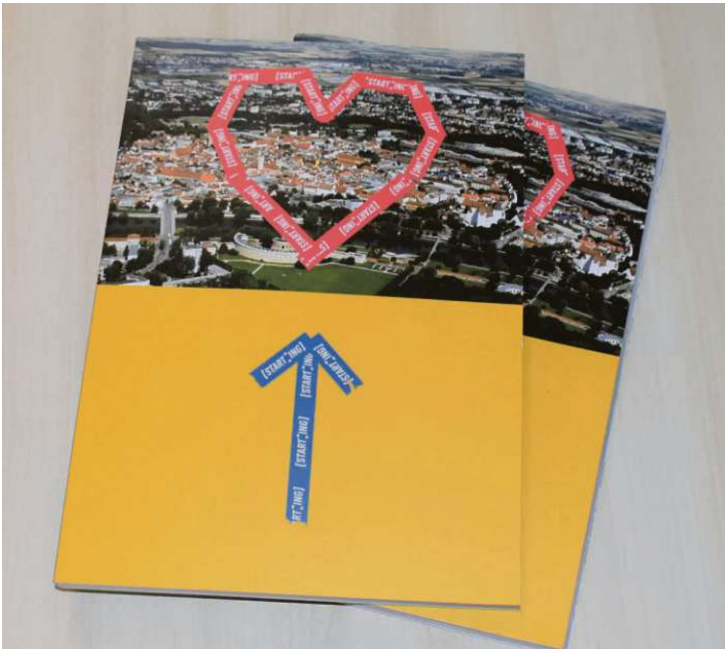
Das Innenstadtkonzept mit seinen 25 Maßnahmen und einem prall gefüllten Ideenspeicher