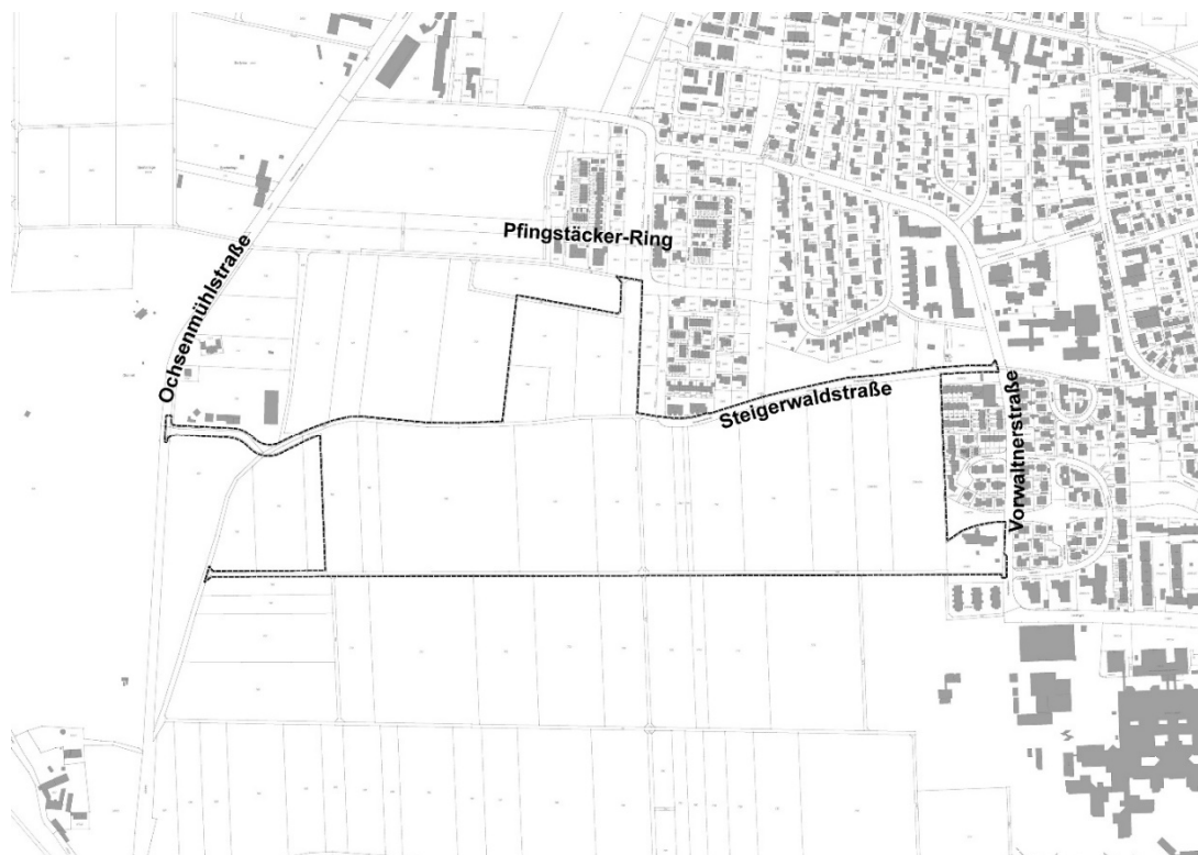
Lageplan zum Bebauungs- und Grünordnungsplan Nr. 196 „Friedrichshofen – Dachsberg“

(Bitte beachten Sie jedoch bezüglich des Zutrittes in das Gebäude die coronabedingten Hinweise an den Eingangstüren des Technischen Rathauses und auf der Internetseite der Stadt Ingolstadt. Gerne können Sie zur Einsichtnahme in die Auslegungsunterlagen vorab einen Termin vereinbaren.)