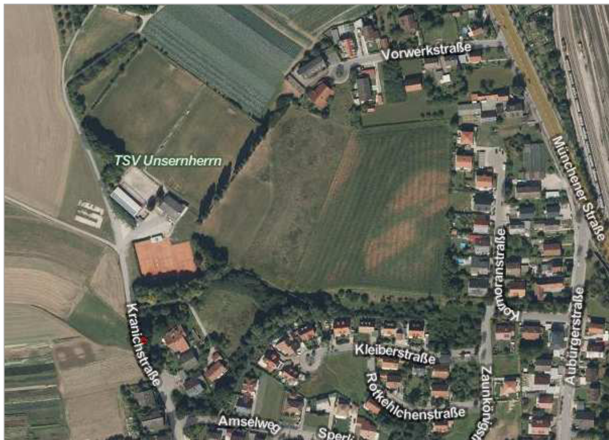
Abb.1: Lage des Vorhabensgebietes

Abbildung 1 zeigt das Vorhabensgebiet im Luftbild.