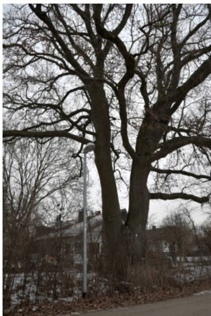
Abb.5: Eiche an der Kranichstraße