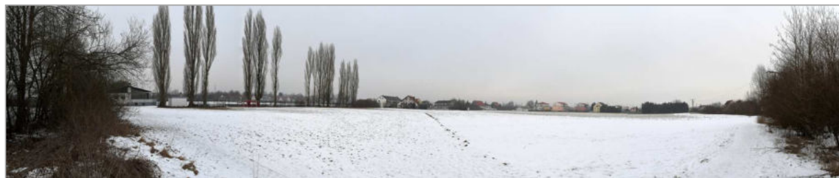
Abb.4: Blick von Westen über die nördliche Hauptfläche des Geltungsbereiches