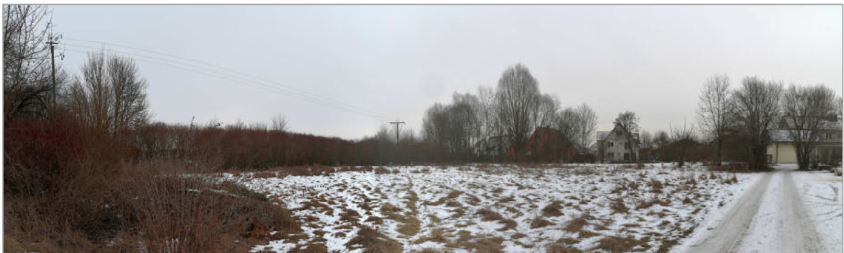
Abb.3: Blick von Westen auf die mittlere Teilfläche des Geltungsbereiches