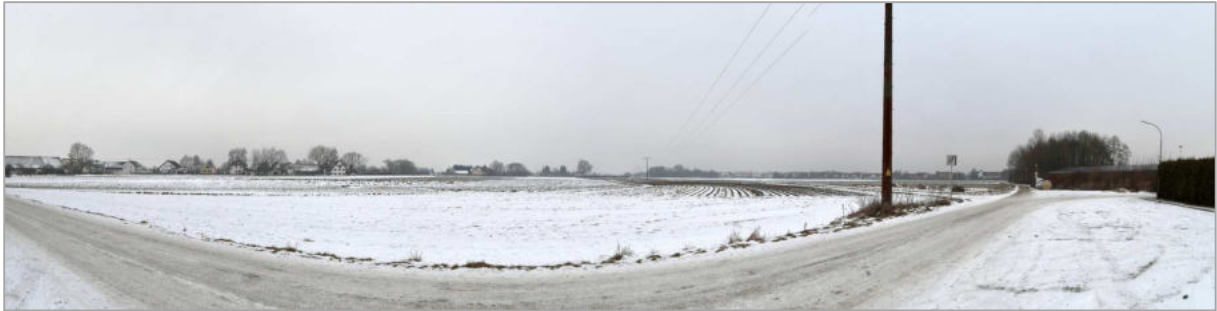
Abb.2: Blick von der Sportanlage nach Westen