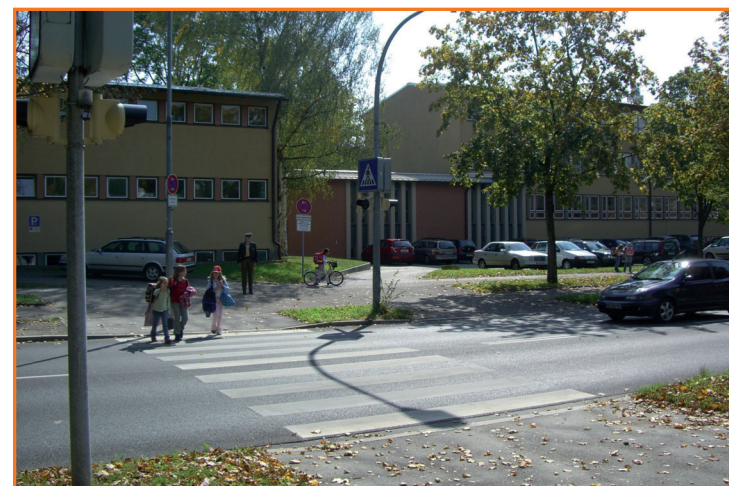
Fußgängerüberweg Auf der Schanz