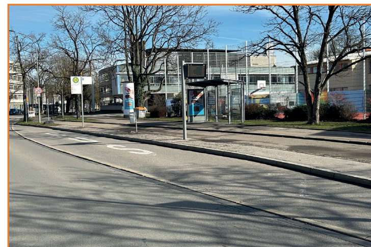
Bushaltestelle - Auf der Schanz