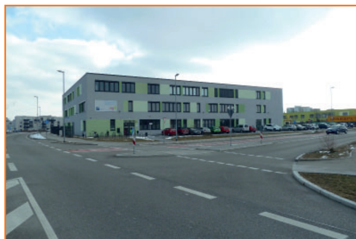
Querungshilfe in der Stinnesstraße