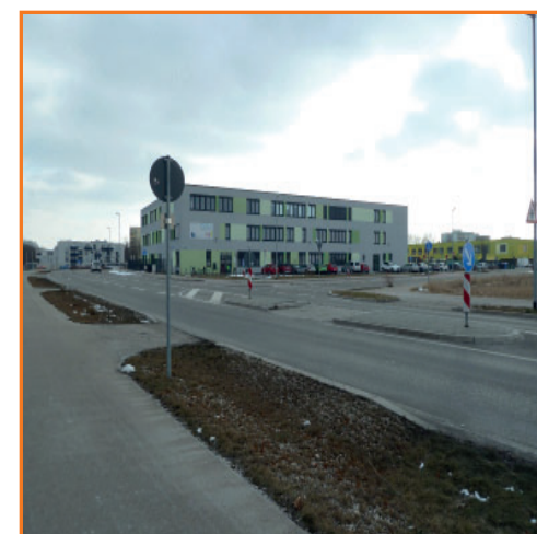
Querungshilfen in der Furtwänglerstraße