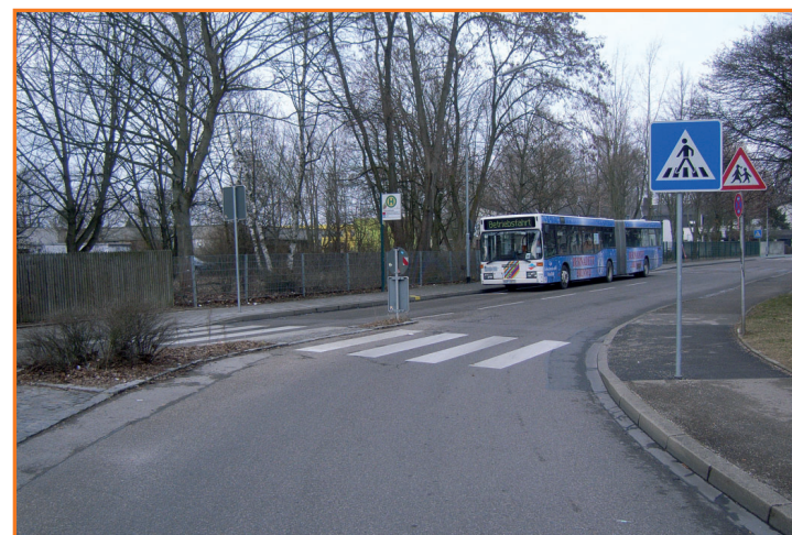
Fußgängerüberweg in der Herschelstraße