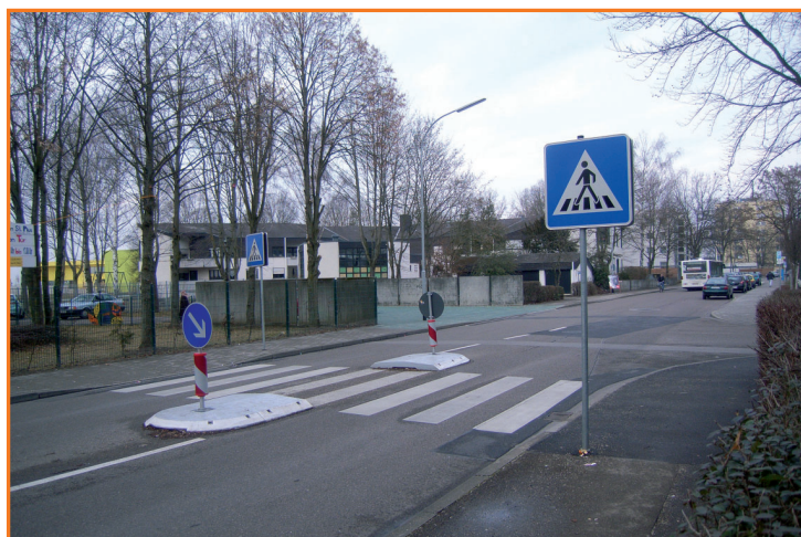
Fußgängerüberweg in der Herschelstraße