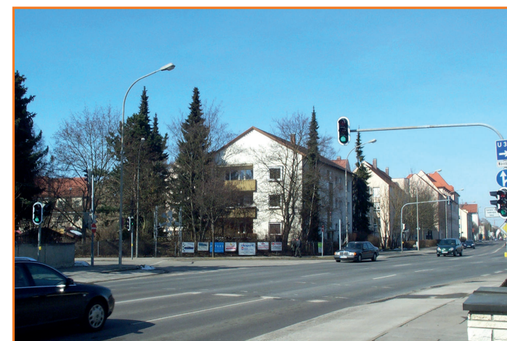
Ampel in der Friedrich-Ebert-Straße