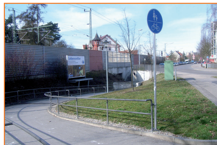
Bahnunterführung in der Frühlingstraße