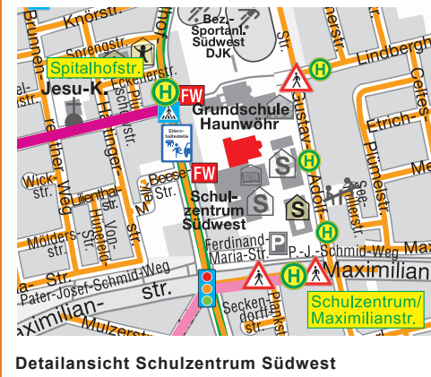
Detailansicht Schulzentrum Südwest

Nach der Nachmittagsbetreuung werden die Schulkinder gebeten, den regelmäßigen Linienverkehr der Busse 44 und 45 mit den Bushaltestellen Spitalhofstr. und Schulzentrum/Maximilianstr. zu nutzen.