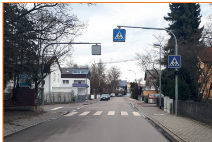
Fußgängerüberweg in der Spitalhofstr.