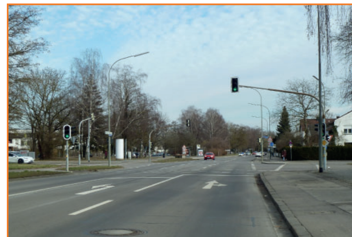
Fußgängerrampe in der Maximilianstr.