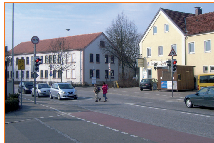
Fußgängerampel in der Münchener Straße