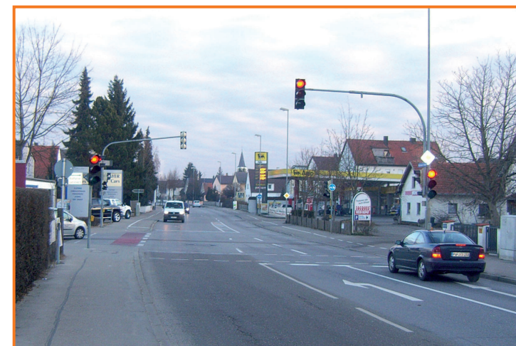
Fußgängerampel in der Münchener Straße