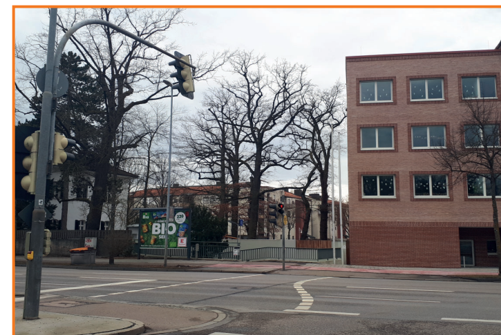
Fußgängerampel in der Münchener Straße