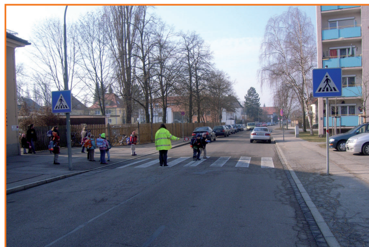
Fußgängerüberweg in der Lindberghstraße