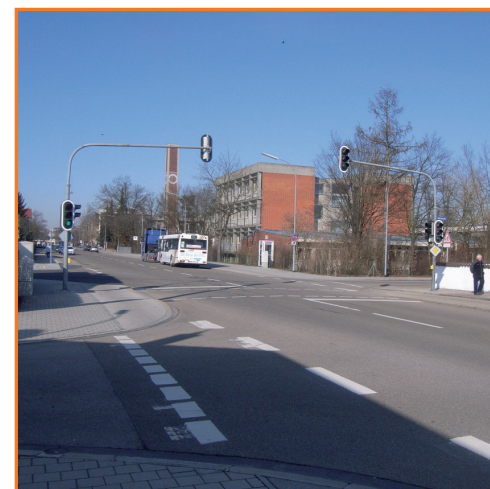
Fußgängerampel in der Feselenstraße und Manchinger Straße