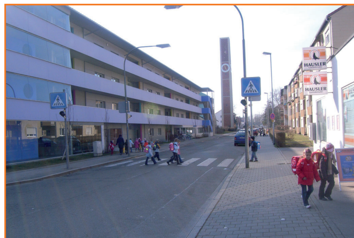
Fußgängerüberweg in der Pettenkoflerstraße