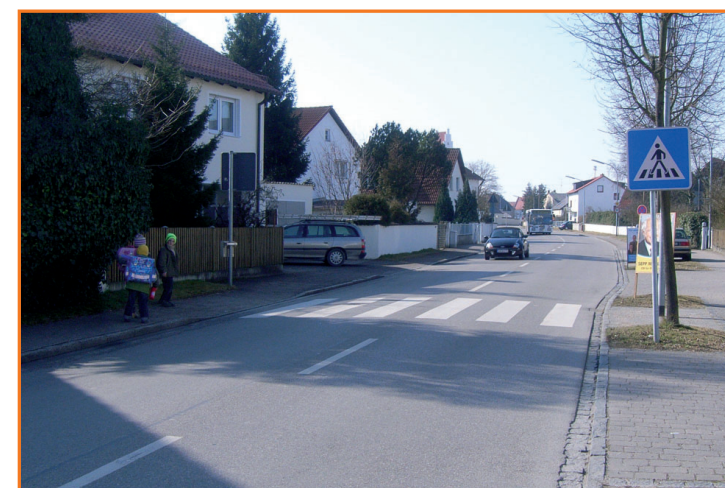
Fußgängerüberweg in der Regensburger Str.