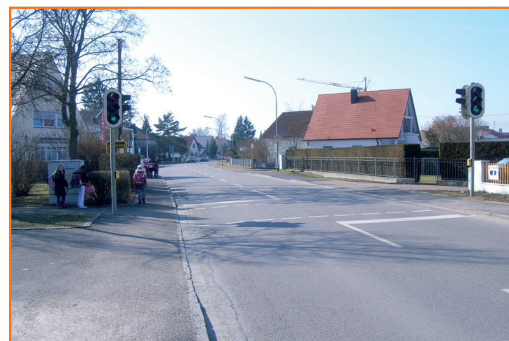
Fußgängerampel in der Regensburger Str.