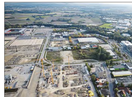
Wirtschaft & Handel

Um die Entstehung und Darstellung neuer digitaler Kunst und Kunstformen am Standort Ingolstadt zu fördern, soll ein Förderverein für digitale Kunst und Kultur („Digital Art“) gegründet werden. Ergänzend dazu könnten die bestehenden Museen um digitale Exponate und Darstellungsformen ergänzt werden. Hierfür soll ein Konzept in Auftrag gegeben werden. Vorstellbar sind zum Beispiel 3D-Darstellungen, etwa im Deutschen Medizinhistorischen Museum.