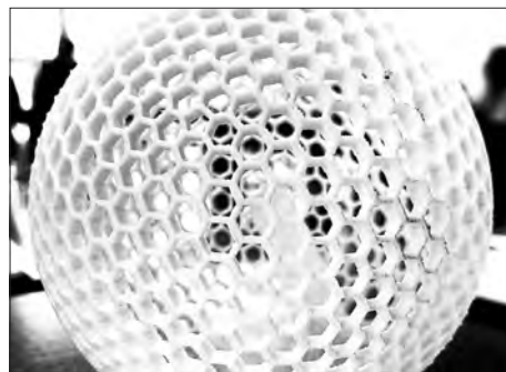
Digitale Kunst & Kultur

Für Patienten, Ärzte und Krankenhausmitarbeiter eröffnen sich durch die Digitalisierung ganz neue Chancen und Möglichkeiten. Die Technische Hochschule Ingolstadt wird sich in Zukunft intensiv den Themen Medizin und Life Sciences widmen und ab dem Jahr 2020 neue Studiengänge im Bereich der Gesundheits- und Lebenswissenschaften anbieten. Kooperationspartner ist das Klinikum Ingolstadt. Dazu sind auch zwei Stiftungsprofessuren geplant.