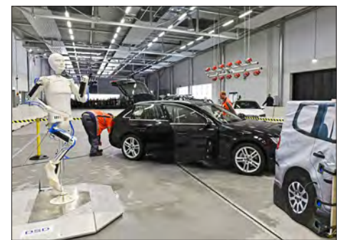
Studenten & Wissenschaft

Als bedeutender Automobilstandort steht der Sektor „Digitale Mobilität & Autonomes Fahren“ mit im Zentrum der Ingolstädter Digitalisierungsstrategie. Einer von mehreren Bausteinen ist die sogenannte „Erste Meile“, eine Teststrecke für autonomes Fahren auf innerstädtischen Straßen. In Ingolstadt wird außerdem ein Fraunhofer-Anwendungszentrum angesiedelt. Das renommierte Forschungsinstitut soll sich speziell um „Mobilität und Infrastruktur“ kümmern.