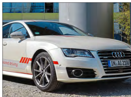
Mobilität & Autonomes Fahren

Die wichtigsten Projekte zum Thema Digitalisierung kurz zusammengefasst