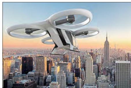
Urban Air Mobility

Im Rahmen der „Vision 10 000“ wollen Stadt und THI gemeinsam den Hochschulstandort Ingolstadt ausbauen – von 5500 Studierenden um weitere 2500 Studenten (weitere 2000 in Neuburg). Die THI wird dafür erweitert und um neue Studienfelder rund um das Thema „Mobilität“ ergänzt. In Ingolstadt wird außerdem ein Wissenschaftsrat eingerichtet, der die Förderprogramme der „Exzellenzstiftung Ingolstädter Wissenschaft – Ignaz Kögler“ strukturiert.