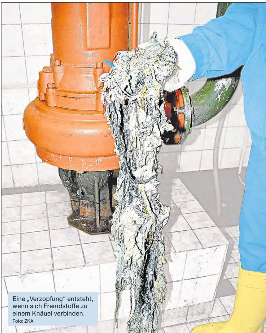
Eine „Verzopfung“ entsteht, wenn sich Fremdstoffe zu einem Knäuel verbinden.

Die Zentralkläranlage Ingolstadt (ZKA) informiert, welche Stoffe wo entsorgt werden sollen