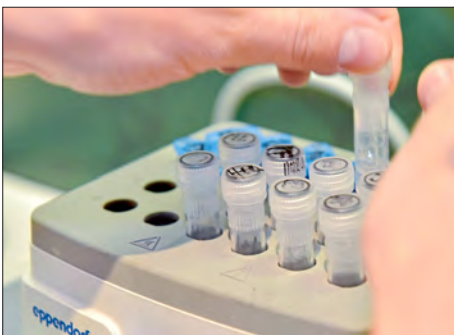
Medizin & Biotechnik

Um die vielfältigen Themen der „Digitalisierung“ kennenzulernen, setzt die Stadt Ingolstadt zusammen mit ihren Partnern auch auf Veranstaltungen wie den „Futurologischen Kongress“, der bei den Besuchern bestens ankam und 2019 wiederholt werden soll. Auch das „Zukunftsforum“ der Initiative Regionalmanagement (IRMA) und der Innovationsallianz „Mensch in Bewegung“ zeigte viele Facetten des Themenkomplexes.