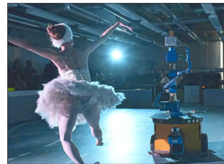
Bürgerbeteiligung & Veranstaltungen

Digitalisierung beginnt schon in den Schulen und Kitas. Geplant sind unter anderem festinstallierte Multimedia-Einheiten, Tablets und Wlan sowie die Einführung von „Office 365“, die Schüler auch privat nutzen können. Alle Kita-Gruppen sollen zudem mit einem Laptop und mindestens einem Tablet pro Einrichtung ausgestattet werden. An das zukünftige Kompetenzzentrum für Künstliche Intelligenz soll ein Schülerforschungszentrum angegliedert werden.