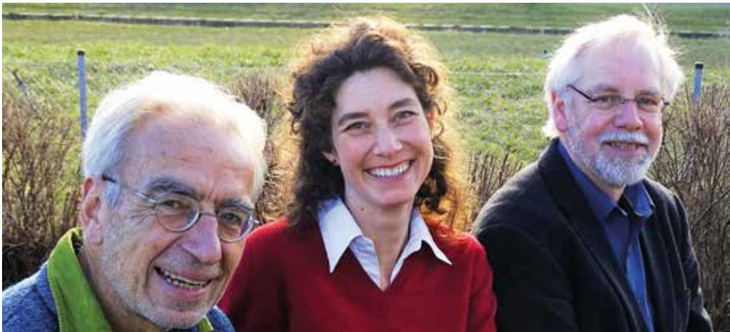
Das Team der Familien- und Erziehungsberatungsstelle