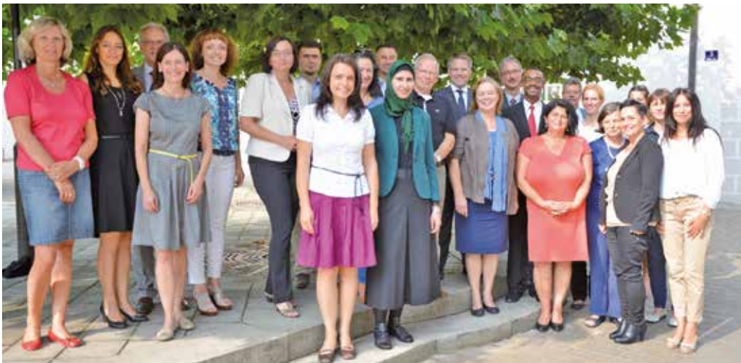
Der Migrationsrat der Stadt Ingolstadt