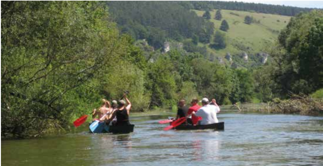
Freizeitgestaltung mit Condrops e.V.