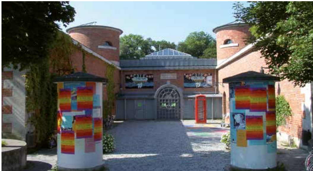
Das Jugendkulturzentrum Fronte 79