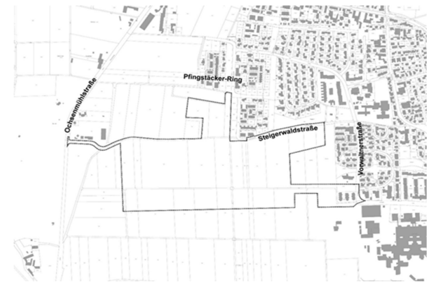
Lageplan zur Flächennutzungsplanänderung