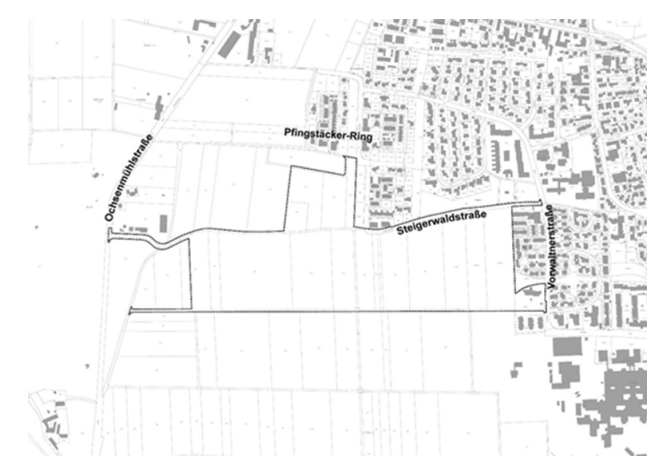
Lageplan zum Bebauungs- und Grünordnungsplan Nr. 196 „Friedrichshofen – Dachsberg“

(Bitte beachten Sie jedoch bezüglich des Zutrittes in das Gebäude die coronabedingten Hinweise an den Eingangstüren des Technischen Rathauses und auf der Internetseite der Stadt Ingolstadt. Gerne können Sie zur Einsichtnahme in die Auslegungsunterlagen vorab einen Termin vereinbaren.)