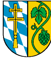
Landkreis Pfaffenhofen a.d. Ilm